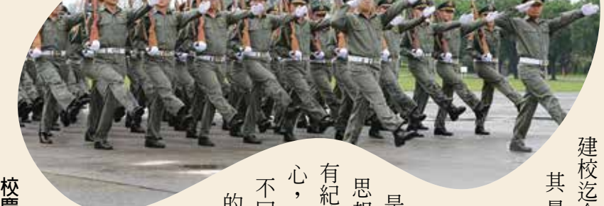
陸軍官校專科班校友為班底的「黃埔九九」正步連，精神抖擻參加陸官九十九周年校慶分列式。