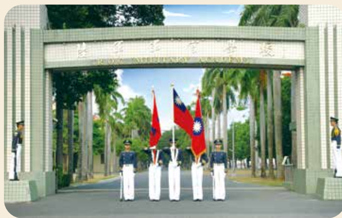
鳳山陸軍官校大門。

八二三戰役期間，金門國軍砲兵部隊對共軍進行反砲擊，給予敵陣地毀滅性打擊。海軍在「八二四」與「九二」兩次海戰，擊沉、重創共軍多艘魚雷快艇及砲艇。海軍陸戰隊「5」部隊突破水際及共軍岸砲之封鎖，搶灘成功，圓滿完成對金門的運補任務。我空軍與中共空軍在臺海爆發十三次空戰，擊落敵機三十二架，戰果輝煌。友邦美國軍援我武器裝備和物資外，派遣飛彈部隊與空軍戰鬥機協防臺灣。我國與美國軍事上的密切合作，有助於嚇阻中共進一步的軍事冒進，結束了第二次臺海危機。