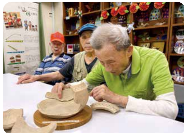
十三行博物館帶領長輩玩陶罐造型立體拼圖，讓長輩體驗如何修復古物。