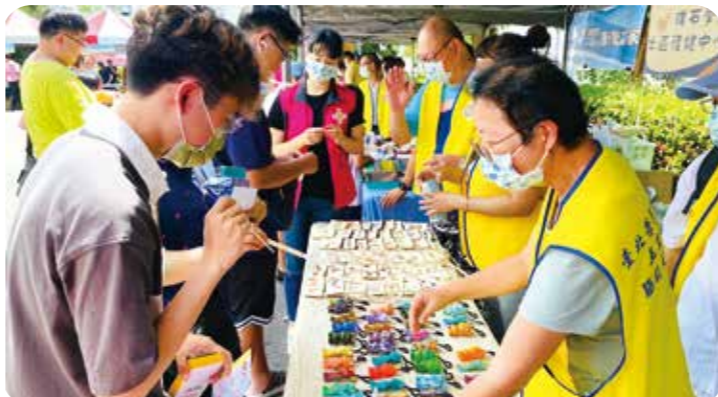
北榮玉里分院設置特色主題攤位，由學員們販售復健作品。

北榮玉里分院為照顧精神障礙者所創立的「玉里模式」，結合居住、治療、復健、訓練、就業等整體連續性支持，協助精神障礙者走出醫院、融入社區，開創自給自足的產業，進而獲得支持性就業。 活動由職能治療師與學員組成的秀姑巒鼓隊表演，許多民眾被學員們打鼓時的氣勢與專注度震懾。北榮玉里分院設有十多家特色主題攤位，由學員們販售復健作品，如麵包、甜點、各式手工布作、木作杯墊等，還有心理科帶領民眾製作靜心瓶；居護所、社工室、精神部及醫企室則提供健康知識宣導等互動小遊戲，讓民眾更加認識醫院提供的服務。 花蓮縣衛生局局長朱家祥、玉里鎮鎮長龔文俊、北榮玉里分院院長胡宗明、副院長平烈勇到場共襄盛舉，院長胡宗明表示，感謝社區居民長年包容與接納，友善地與精神障礙學員互動，對學員的復原有很大的幫助。