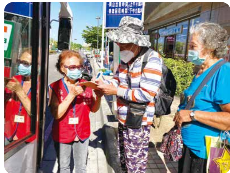
榮欣志工(左)協助榮民搭車就醫。