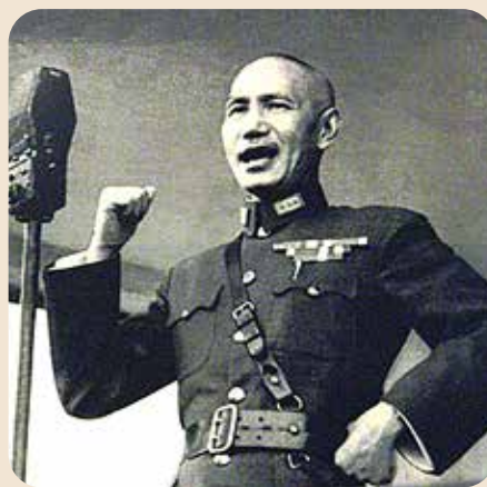
蔣委員長發表盧山聲明，象徵中國抗日戰爭全面開始。

日本自明治維新後，仿效歐美列強，推行軍國主義，積極向外侵略擴張領土。先是於甲午戰爭擊敗滿清取得臺灣，接著在日俄戰爭擊敗帝俄，取得我東三省之利益。民國十七年十二月二十九日，東北宣布易幟，服從南京政府。日本見我北伐成功，全國統一，更積極侵華。 日本關東軍於民國二十年發動「九一八事變」，接著佔領東北三省及熱河。此後日本繼續以蠶食手段，企圖逐步佔領華北，以肢解中國。二十二年春，日軍發動長城戰役。五月三十一日，我國在日本脅迫下簽訂「塘沽停戰協定」，將冀東劃為非武裝區。二十四年六月四日，日本藉由換防名義，增兵津滬。六月十日，脅迫我方達成「何梅協定」。並公開主持華北自治運動，但遭我國國上下一致反對，未能得逞。 此外，日本命令偽蒙軍李守信部佔領察北六縣，利誘蒙古德王宣布內蒙古獨立，復辟使李守信及王英侵擾綏遠。至此日本欲奪取我華北的野心，昭然若揭。北平、天津為華北政治、軍事、經濟、交通重心，為日軍西侵要綫，南犯晉魯的戰略要地，故日軍覬覦尤為急切。 山雨欲來風滿樓 自民國二十四年九月起，日本天津駐屯軍，依據「辛丑和約」外國軍隊駐華之權利，即不斷以「保僑」名義，要求增兵。二十五年一月，日本天津駐屯軍更名為「華北駐屯軍」，顯示該軍的活動範圍不再局限於平津地區，企圖擴張到整個華北地區。其次，駐屯軍司令官軍階由少將升級為中將，使其地位與關東軍司令官平行，有獨立處理華北中日兩國事務之權力。