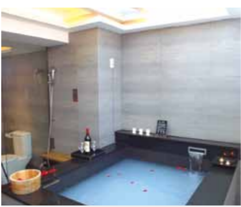
北投區知名溫泉會館套房內的泡湯池。

臺北市新北投「歷史風味的女巫之湯」——新北投位於臺北市最北端，原是凱達格蘭族的居住地，原住民稱為「北投」，是「女巫」的意思。北投溫泉最重要的特色是「溫泉熱氣」，因地底岩漿加熱，噴發出地表，並伴隨蒸氣，這正是北投溫泉與其他溫泉的不同之處，其他地區的溫泉是以湧泉形式流出地表。 日據時代，日本人平田源吾在北投開設臺灣第一家溫泉旅館，為北投溫泉開啟繁盛的一頁，直至今日，歷史景物都保存良好，成為北投溫泉觀光的一大亮點。 新北投同時也是臺灣「酒家菜」的發源地，日據時代，時人愛泡北投溫泉，不但建設許多會館和飯店，也帶動酒家文化的興盛，發展出許多政商名流愛吃的酒家菜。酒家菜講究食材、重視排場，早年稱為「官菜」，講究刀工、火候及擺盤，讓料理充滿著華感，堪稱視覺與味覺的華麗饗宴，口味因配合酒客飲食習慣，稍微偏重。 新北市金山、萬里「依山傍海，賞景兼泡湯」——金山、萬里溫泉屬大