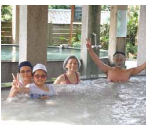
關子嶺溫泉以泥漿泉聞名，遊客邊泡湯邊敷臉。

臺南市關子嶺「黑色泥漿泉，養顏美容又保健」——關子嶺溫泉為全臺唯一的「泥質溫泉」，因地下為泥質岩層，泉水湧出時混入泥岩微粒與各種礦物質、鹽類，使水質呈灰墨色，而有「黑色溫泉」之稱。 關子嶺溫泉自日據時期迄今已超過百年歷史，屬鹼性碳酸泉，溫度約在攝氏七十五度，洗後全身舒暢。據當時臺灣總督府的調查報告指出，關子嶺溫泉含有礦物鹽，同時史誌記載關子嶺溫泉有「天下第一靈泉」之譽，具有養顏美容、養身保健等功效，是天然的泥漿溫泉。 到關子嶺泡黑色泥漿泉的同時，也不要忘了品嚐用土窯燒烤而成的甕仔雞，軟嫩的雞肉與香甜的肉汁，是絕對不能錯過的美味。 屏東縣四重溪「清靜幽雅百年優質好湯」——四重溪溪屬沉積岩分布區，因有天然溫泉自地下湧出，古時稱「出湯」。清朝同治年間，沈葆楨巡臺，因跋涉經過四重溪才到此地，便改名為「四重溪」。 源頭來自山麓石縫中的四重溪溫泉，周圍有群山環繞，景致秀麗，清靜幽雅。四重溪溫泉泉溫隨季節轉換，多在攝氏五十度至八十度之間，泉質屬鹼性碳酸氫鈉泉，對促進人體血液循環、緩和肌肉僵硬與紓解壓力有相當大的幫助。 四重溪水質清澈，是提供養鴨人家野放鴨子覓食的好飼場，鴨子產下鴨蛋的蛋黃偏橙紅色，故稱「紅仁鴨蛋」，是四重溪著名的特產。 東部地區 花蓮縣瑞穗「黃金暖湯，特色溫泉花」——瑞穗溫泉是全臺最大的溫泉區，早在民國八年，就被日本人開發，當時稱為「滴翠閣」。 瑞穗溫泉的泉溫約四十八度，屬弱鹼性的氯化物碳酸鹽泉，泉水中富含鐵、鋇等礦物質，泉水中的鐵質遇到空氣氧化後，會在水面形成一層略帶鐵味的黃褐色結晶物，稱為「湯花」或「溫泉花」。許多