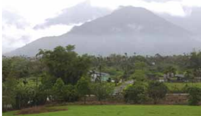
尋尋覓覓五年，作者終於找到夢中淨土，捨高官而不就，寧笑傲山林。

在眾多人事主管裡，我是唯一獲得歷任臺北市長獎、銓敘部、人事局論文獲獎更是無數，更創下了公務員在十分鐘內上市政府大禮堂連