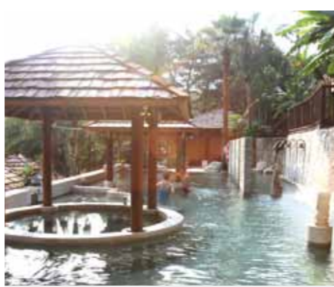
谷關泡湯享受悠閒身心靈。

臺中市谷關「泡湯森呼吸，遠眺高山溪谷」——谷關溫泉發現於日本明治時代，又稱為「明治溫泉」，相傳明治天皇泡完谷關溫泉後，一舉得「子」，因此谷關溫泉也稱為「生男湯」。 谷關地勢險要，溫泉自山麓間湧出，穿流在山岩間，谷關溫泉因含有硫化物及鹽分，靠近時可聞到硫化物特有的氣味，泉水清澈，水溫在攝氏四十八度左右，深受遊客喜愛，目前有水療、日本庭園及松林溪畔等不同風味的泉池，是中部橫貫公路著名的溫泉勝地。 到谷關除了泡溫泉，就要吃美味的