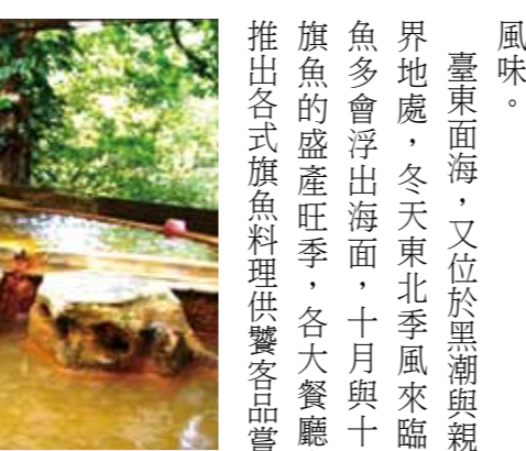
瑞穗紅葉溫泉區。

6. 若工作的關係，需要久站或久坐時，則可穿著彈性襪。 三、腿部問題的治療 1. 若皮膚瘙癢時，應避免使用指甲搔抓，以避免細菌進入皮膚而造成蜂窩性組織炎。 2. 若是有慢性皮膚潰瘍，通常需要較長時間才能癒合，應盡速就醫，尋求專業的協助。 3. 安排靜脈都卜勒超音波檢查，可提供關於靜脈逆流的資訊，並可由此來評估治療的方式。