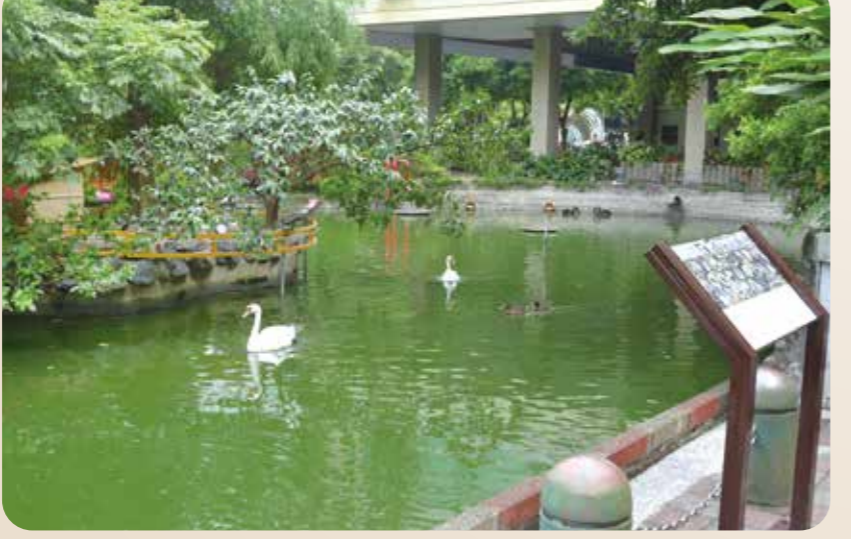
看著天鵝在忘憂湖自在優游，可以讓人忘掉煩惱，療癒心靈。

為了讓更多患者感受到綠意帶來的舒適與寧靜，中正樓五樓外面的空間打造成空中花園，作為高齡醫學中心及復健醫學部病友的活動場所，配備了健身器材和戶外設施，吸引大量病人在此散步復健，還帶動了五樓通往空中花園走道旁「靜耘坊」