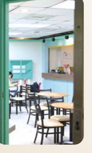
「靜耘坊」由北榮附設庇護工場一群身心障礙者經營，提供的餐點非常平價，雞絲麵是陳威明院長的最愛。

陳院長也致力提升醫院環境品質，其中包括綠美化工程。從副院長到院長，七年來在他推動及各界贊助協力下，為北榮種植了數萬株花卉與樹木，使整個醫院宛如都會大公園，成為一個充滿生機和人文關懷的療癒之地。