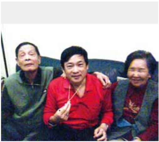
作者（中）與父母親合影。

的確，端午節前我在國外，小女PO父親照片，瘦削臥床，顯現營養不良，與我出國前，已是判若兩人。回想上次我在國外，父親抱怨外傭不會做菜，盼我早日回家教傭。父親信中：「你終於回家了，她（傭）