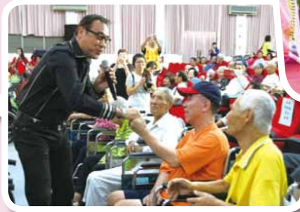
▼「曉水珠關懷團」為白河榮家長輩而唱。