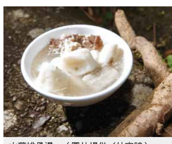
山藥排骨湯。

規定，提前預告，同時依第十七條規定計算資遣費，並於終止勞動契約三十日內發給資遣費。此外，若勞工無法勝任工作，實務上認為必須在雇主使用勞動基準法所賦予之各種手段，仍無法改善之情況下，始得終止勞動契約，以符合「解僱最後手段性原則」(一〇四年台上字第一二九號民事判決參照)。 王先生若不符合上列事由而遭終止勞動契約，則其終止不生效力，王先生可主張勞動關係仍繼續存在，而請求雇主繼續給付薪資。亦得主張雇主不依勞動契約給付工作報酬，或雇主違反勞動契約或勞工法令，致有損害勞工權益之虞，向雇主主張終止勞動契約而請求雇主給予資遣費。(雲林縣榮服處法律顧問簡承佑律師/提供)