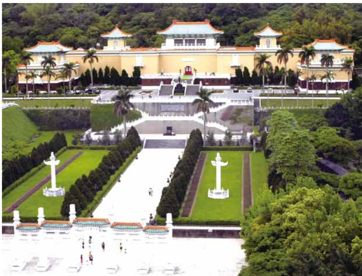
國立故宮博物院鳥瞰圖。

【記者林均專報導】收藏許多珍貴中國文物的國立故宮博物院，是臺灣規模最大的博物館，也是世界各國遊客到臺灣旅遊，絕對不會錯過的景點；而今年十二月二十八日於嘉義縣太保市成立的「國立故宮博物院南部院區—亞洲藝術文化博物館」也即將開館。 未來故宮南北兩院透過歷史文物展覽的交互輝映，將成為臺灣歷史文化觀光兩大重鎮。 故宮北院—華夏文物寶庫 座落於臺北市士林區外雙溪，環繞在青山綠樹中的臺北故宮，古色古香，為中國傳統宮殿建築，氣勢非凡。民國五十四年十一月十二日，臺灣「國立故宮博物院」落成，這天正是國父孫中山先生的百歲誕辰，故又稱「中山博物院」。此處收藏許多珍貴的中國歷史文物，包括石器、青銅器、陶器、玉器、書畫等，近七十萬件，年代幾乎涵蓋中華文化五千年的歷史，堪稱全球收集華夏藝術文物的翹楚。 說到故宮收藏的文物，知名度最高的是「翠玉白菜」、「肉形石」與「毛公鼎」三件文物，雖然只有「毛公鼎」被列為「國寶級文物」，但仍有人稱這三件文物是「故宮三寶」。 翠玉白菜 ：翠玉白菜是故宮珍藏的文物之一，利用翠玉天然的色澤雕刻而成，綠色菜葉上還雕出蝨斯和蝗蟲，如此精雕細琢而成的翠玉