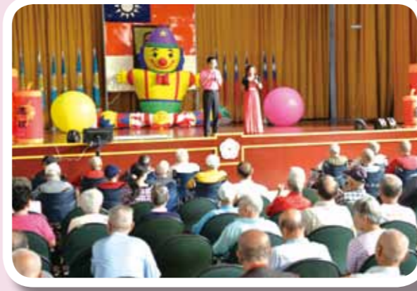
▲資深藝人與榮民伯伯互動、交流同樂。