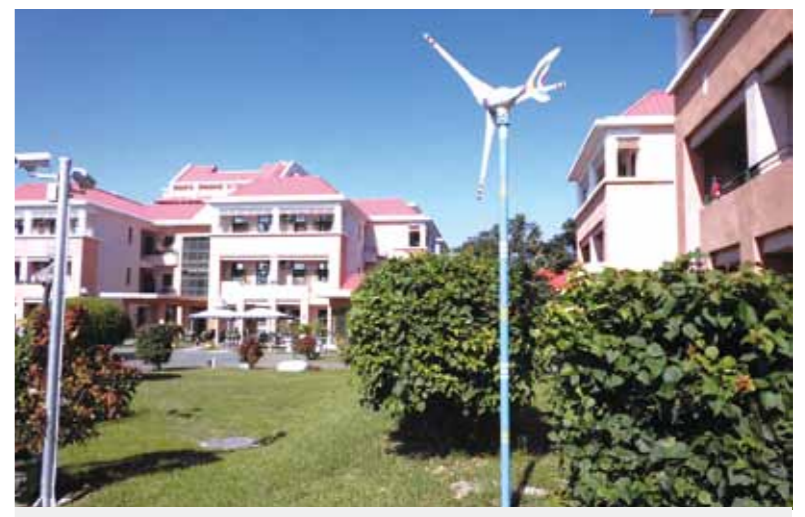
庭園傘棚下，徜徉微風，輕啜咖啡，都付笑談中的榮家生活，令人豔羨！

【本刊訊】臺東縣榮服處日前會同臺北榮總臺東分院及馬蘭榮家辦理「榮家內住參訪活動」，為參訪榮民眷推介馬蘭榮家地區的環境、夫妻安養房等設施介紹與說明。上項作業是輔導會十六所榮家、十九所榮服處及十五所榮民醫院等屬機構，為配合政府「建置長期照顧服務網」政策，全面開放各榮家安置榮民公費、自費安養及養護業務的重大改革。 此次「馬蘭健康快樂園區」參訪活動，是由臺東榮服處安排榮民眷前往參觀，馬蘭榮家各堂長親自為來賓導覽、介紹及說明。由於輔導會所屬各榮家綠地廣大，各項生活機能、休閒設施俱全，服務人員都為有執業執照的專業人士，是年長者非常宜居的安養、養護所在。就以馬蘭榮家為例，因臺東縣榮服處、臺東分院及馬蘭榮家都在一個園區，就榮民權益之服務需求或身體不適的就醫需求，在此內住榮民都可享有極大的便利。 目前自費申請入住的收費標準：自費安養服務費每人每月六千元；自費養護服務費每人每月六千八百元；伙食費每人每月四千零五十元。各榮家床位狀況及候住人數，可逕上輔導會全球資訊網查詢，網址： http://www.yag.gov.tw 。榮民尚有進住榮家需求，可去電或親赴各榮家洽辦，也可洽詢各地榮服處協助轉介安置。 與外住榮民共享榮家資源，並促進內住榮民社會參與，如保健組門診、復健服務、結合關懷據點、提供關懷訪視、電話問安、餐飲服務等，並邀請榮民參與宗教信仰、藝能競賽及各種文康、慶生、樂齡學習等活動。