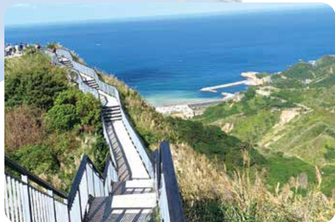
▲報時山步道是輕鬆短程的海景步道，沿途景色宜人。