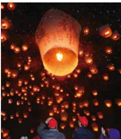
天燈冉冉升空，照亮平溪夜空。

在冷冷的冬天搭上台灣好行北投竹子湖線，沿途可至北投看地熱谷、泡湯暖身子，還可以至陽明山國家公園及竹子湖散步賞花，是一趟能溫暖身心又舒壓的走春行程。