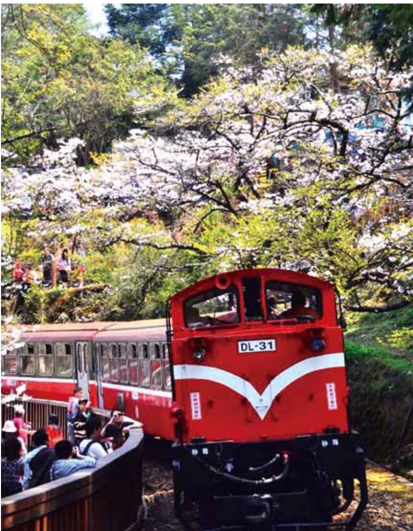
阿里山小火車。