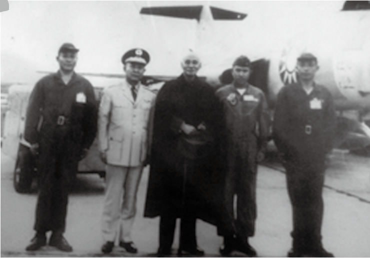
先總統蔣公與 RF-101 團隊成員合影。

RF-101又稱「巫毒式偵察機」，是美國麥唐納公司出產，原設計是超音速戰鬥機，用來執行轟炸機護航任務。空軍接收此型飛機後，