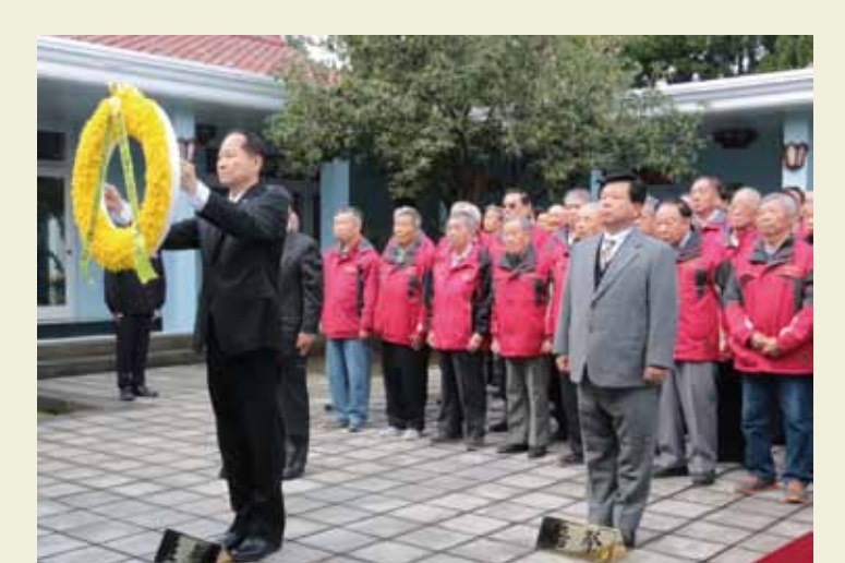
懷念經國先生 一月十三日是經國先生逝世二十八週年紀念日，輔導會主任委員董翔龍（前左）日前偕同處會主管以上長官、所屬機關、投資事業會黨首長及四十位榮民代表，赴桃園頭寮恭謁經國先生陵寢，董主委向經國先生靈前獻花，表達對「老主任委員」的感念及追思。

繆伯初（左）亡妻繆華女士生前最後願望，由葛光中院長代表受贈。