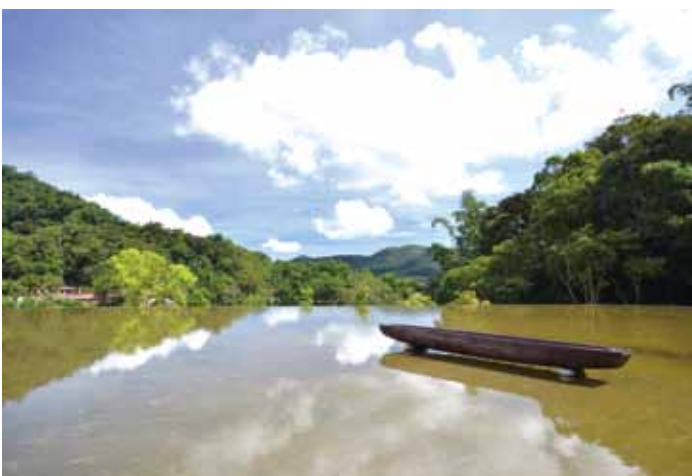
日月潭向山遊客中心。