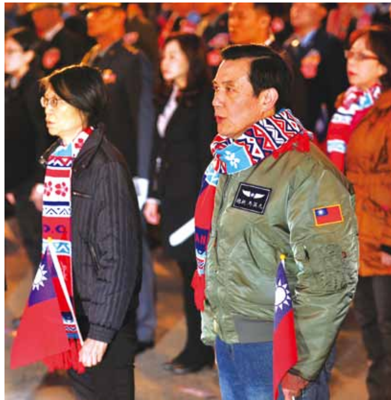
馬總統偕夫人周美青與總統府前的民眾一起唱國歌，迎接一〇五年元旦。

【本刊訊】馬英九總統在迎接中華民國開國一〇五年元旦當天，發表「八年興革·臺灣升格」元旦祝詞。向國人提出「三個關鍵成果」及「三個誠懇提醒」，希望全民在分享成果的同時，也一起思考未來即將面臨的挑戰。 馬總統與吳敦義副總統在元旦當天上午，出席在總統府前廣場舉辦的升旗典禮。隨後，在總統府大禮堂主持開國紀念典禮暨元旦團拜。總統首先向全體國人表達他內心誠摯的感謝。感謝臺灣人民在兩次大選當中，信任他、託付他，讓他有機會與人民一同打拚，一起創造了許多前所未有的豐碩成果。 總統提出「三個關鍵成果」，第一個關鍵成果「外交躍進，友善國際」，強調過去七年多來，政府努力推動「活路外交」，扮演「和平締造者」與「人道援助者」的角色，獲得豐碩的成果，也贏得國際社會的尊敬。政府與美國、日本、歐盟、東協、紐澳等國在安全、經貿、文教各方面的關係，都是三、四十年來最好的狀態。二十二個邦交國，互動頻繁，友誼穩固。而給予我國免簽證、落地簽的國家、地區，以往只有五十四個，目前已經擴增到一百六十一個，我國護照「好用」的程度，進入全球前二十五名。 第二個關鍵成果是「兩岸搭橋，和平永續」，七年多來，政府成功讓臺灣海峽從過去的衝突熱點，轉變為和平大道。堅持在中華民國憲法的架構下，維持臺海「不統、不獨、不武」的現狀，在「九二共識、一中各表」的基礎上，推動兩岸和平發展。因為雙方都具有足夠的互信，兩岸關係終於出現重大突破。去年十一月七日，馬總統秉持對等與尊嚴原則，在新加坡與大陸領導人習近平會面，針對「鞏固兩岸和平、維持臺海現狀」交換意見。這次的「馬習會」為兩岸搭了一座跨海大橋，讓雙方藉此建立領導人平起平坐、見面會談的新模式，也讓未來的兩岸領導人可以遵循比照，延續兩岸和平繁榮的現狀。 第三個關鍵成果是「照顧弱勢，實現公義」，過去七年多來，政府努力提高弱勢福利，改革國家財政，增進勞工權益。政府改革全民健保制度，實施「弱勢民眾安心就醫方案」，目前健保鎖卡人數，已由九十六年的六十九萬八千人下降到四萬人，再也不會有人因繳不起健保費而無法就醫。同時，一〇二年政府實施二代健