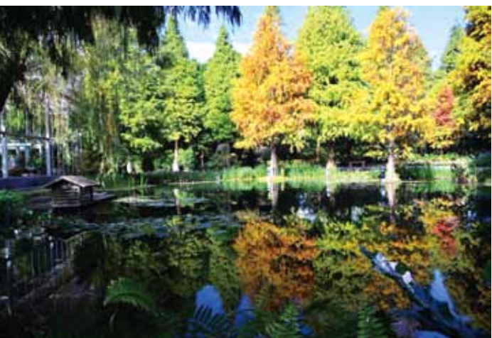
田尾菁芳園落羽松。

景色，美不勝收，附近還有怡心園等彰化著名景點。田尾線的頭尾兩站都是高鐵站，遊客跨縣市旅遊更方便。