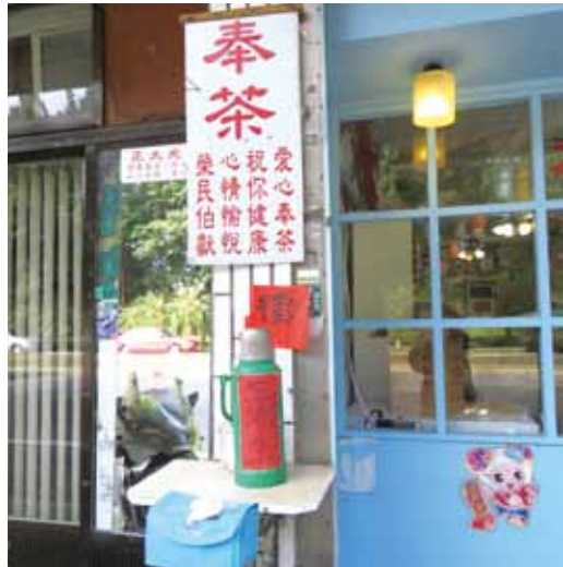
雖只是毫無價值的白開水，卻讓人心溫暖。

只是到了現代，各式便利商店、茶飲店林立。奉茶這麼貼心的設施，早已消失在這高度功利的工商社會中時，卻不經意的發現，路旁大大的紅色招貼——「奉茶」。下方寫著「愛心奉茶，祝你健康，心情愉悅！榮民伯獻」的小字。特製的小茶几上，一只熱水瓶，瓶上貼著「熱開水」字條，還有一行年月日的小字，像是產品的日期，榮民伯更貼心的在小茶几旁放了一盒紙巾，任路人取用。