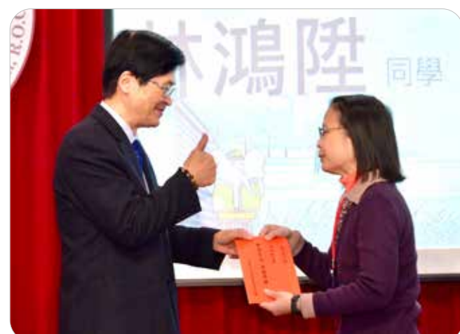
主委對出席代領獎學金的家長比讚，嘉許他們教養子女的辛勞貢獻。