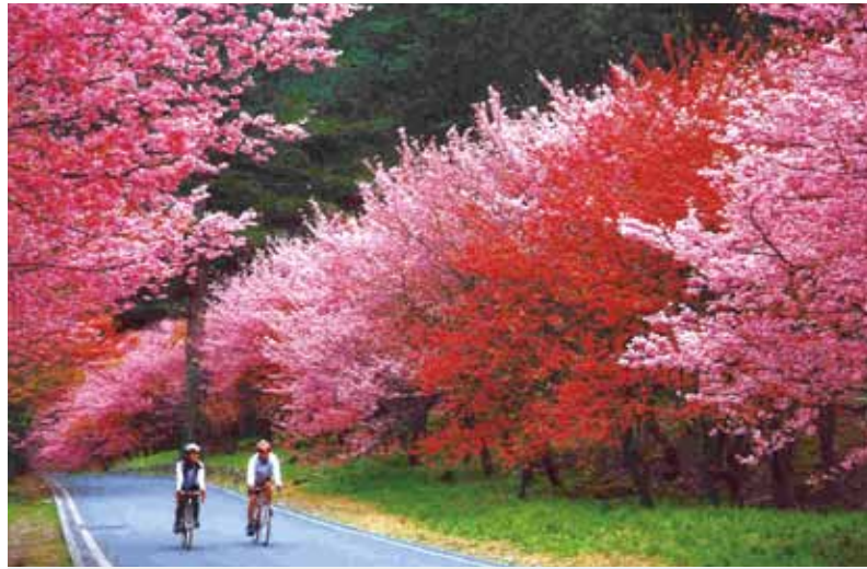
穿梭櫻花林中，恍若置身人間仙境。

【本刊訊】今年的武陵農場櫻花季為二月六日至二月二十二日，入場遊客總量管制每天上限六千人，夜間十一時至清晨六時將實施不開放入場的淨場措施。 武陵農場表示，花季期間，實施車輛入場限制。其中，一日遊大眾運輸巴士八十輛、國民旅遊團客大型巴士廿輛、中型巴士十輛，共計一百一十輛車次可入場賞櫻。 花季管制期間，須憑車輛通行證始放行入場，並於收費站前三公里的中一百二十四線道口，配合警方設立檢驗點。其中，住宿、露營、登山遊客約一千八百人採一房一車一證方式核發車證，一日遊旅客管制限制為四千二百人，均以大眾運輸巴士及遊覽車憑車證入場。入場後車輛需於指定地點上、下車，按照現場交管人員指揮行駛。 武陵農場有關一日遊散客三千二百人的輪運規劃，計有三星綜合運動場（國光、首都客運）及梨山（豐原客運）等六條路線。今年也比照去年提供身障人士賞櫻機會，每天開放三輛身心障礙專用車輛申請入場。 為提升遊憩品質，今年武陵農場櫻花季比照前三年，持續規劃遊客總量管制、車輛分流管制、賞櫻專車入場等交通疏導方案。農場表示，櫻花季交通管制措施必會造成遊客的不便，但為維護整體遊憩品質，希望上山賞花的遊客體諒，並配合遵守相關措施。 農場呼籲遊客入場賞花時，儘量搭乘大眾運輸工具；於場區遊憩時，請愛惜環境，不攀折花木；出發前先查詢路況，並收聽警察廣播電臺相關交通資訊；上山時，注意沿途電子字幕顯示與臨時指標，如遇道路阻塞，也請耐心慢行，小心駕駛，讓賞花之旅順利、平安。