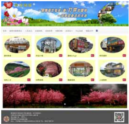
「榮光商店—夢想園區」首頁。

【本刊訊】輔導會為整合、幫助有意創業的榮民眷，以分享共榮圈的概念，運用谷歌地圖（Google Map）定位搜尋的強大功能，設計開發「榮光商店—夢想園區」專屬網站，幫助創業有成的榮民眷行銷及露出各項優惠、折扣回饋訊息，並積極提供創業工具與管道，以實質嘉惠榮民眷。 「榮光商店—夢想園區」網站是以榮民眷為企業的負責人或代表人，為其申請資格者，由地區榮服處完成審查後，始得加入為會員。網站的主要特色與功能簡介如下： 一、創業名圖專區：分享創業有成榮民的奮鬥歷程、回饋社會公益及提攜後進等故事，表彰榮民典範，並提供輔導會創業資源、創業諮詢窗口，以及創業顧問包等相關資訊，協助榮民眷創業圓夢。 二、人氣商店：點擊人氣商店時，網頁可同時呈現六家商家的照片及簡介，點選某張照片後，即可查看商家經營的產品、特色與相關資訊。 三、好康報報：刊登商家的各項週年慶、折扣、促銷等優惠訊息，網站以一頁六個活動訊息的方式呈現，點選即可查看詳細優惠資訊。 四、商家搜尋：運用 Google 搜尋功能，消費者可依需求選擇地區、類別或關鍵字等方式，搜尋想要尋找的商家。 五、相關連結：與輔導會全球資訊網、就業服務網、榮民職訓網以及勞動部的臺灣就業通、銀髮資源網、青年創業及圓夢網、國軍福利站網路商店等相關就業、職訓、創業、福利網站建立連結，構成服務網絡，之後會依需求適時增加。 六、附近商家：運用 Google 定位功能，可依當時消費者所在位置，列出距離最近的六家榮民眷商店，提供消費者需求選擇。 「榮光商店—夢想園區」屬於服務與行銷兼具的平台，目前透過累計瀏覽人數的呈現，提高商家經營的意願，未來將增加「消費者留言分享」、「星級評比」等服務，提升網站與大眾的互動性，達到協助榮民眷商家行銷的最大效益。 目前網站已擁有一百四十家會員，將於一〇五年農曆年前正式上線，竭誠歡迎創業有成的榮民眷商店加入，共惠共榮。 「榮光商店—夢想園區」網址： http://govac.gov.tw 。