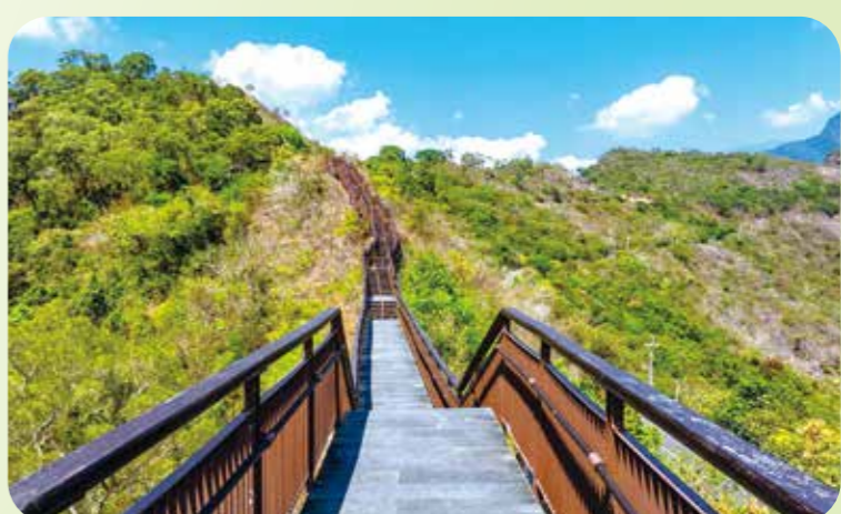
↑小長城道沿著龍頭山脊脊稜線建造，一路延伸至多納高吊橋，沿途風景秀麗。（圖／茂林國家風景區管理處）

建議自行開車前往，闔家登上蛇頭山觀景臺，欣賞特殊曲流景觀全貌。該區域有不少魯凱族居民，據傳為百步蛇的後裔，蛇圖騰對族人而言，是一種祖靈的象徵，遊客覽勝之餘，亦應對此懷抱崇敬態度。