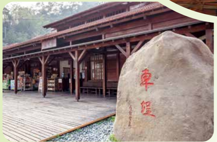
↑水里蛇窯是臺灣現有最古老、最具傳統鄉土文化的柴燒窯。

附近景點有：一、車埕車站：為集集支線鐵路終點站，現在的車站是經歷九二一地震後，由日月潭國家風景區管理處重建而成，包括站前空地使用原木鋪設，極富特色。二、日月潭國家風景區向山遊客中心：位處水