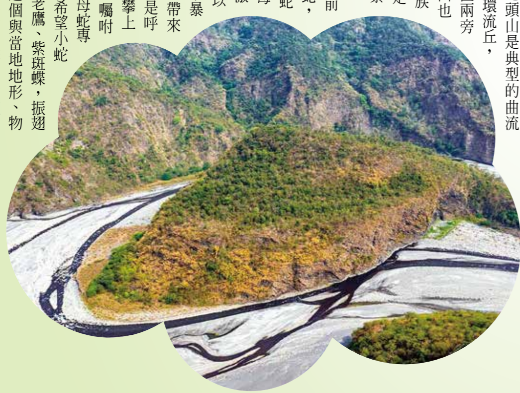
↑蛇頭山外觀像個蛇頭，可於景觀臺一覽全貌。

蛇頭山屬茂林國家風景區管理處，位於茂林區高一一三三線十二公里處，在前往多納里的路上。此地因神似百步蛇盤於濁口溪的樣貌而得名。蛇頭山是典型的曲流地形，為一處環流丘，與龍頭山分置兩旁相對映，該山也被視為守護族人的聖山，是茂林區著名景點之一。