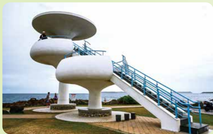
↑風櫃洞的白色飛碟涼亭，與藍天碧海形成超仙美景。

寶島臺灣無論山巒海景，皆值得國人多多親近，初春適合帶著長輩出門散散心，或是和兒孫全家出動，計畫一個放鬆、放電小旅行。蛇年踏青，讓我們一起出發吧！