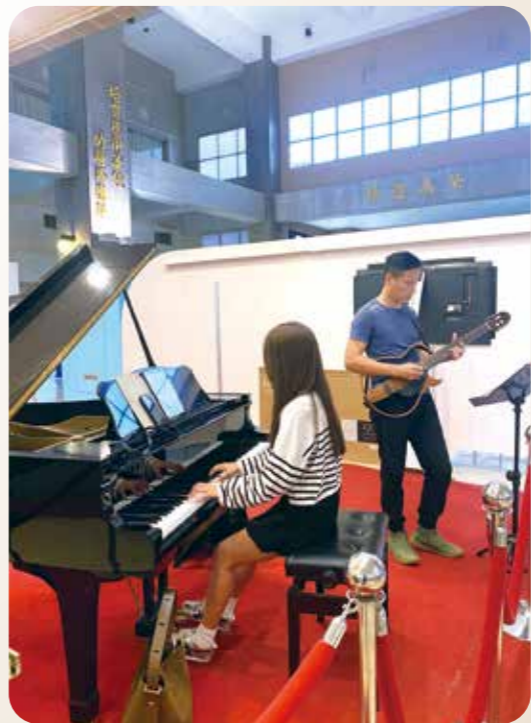
醫療大樓大廳的音樂表演區，安排藝術家、音樂志工定期演奏。

透過以上種種措施，高榮企盼能更好地照顧病患的情緒與精神需求，塑造出具有人文氣息的醫療環境，透過藝術、文化與人文關懷，提升病患、家屬與醫護人員的良好互動，讓病人及家屬感覺到醫院不是冰冷環境，而是充滿人文氣息的生命之美。