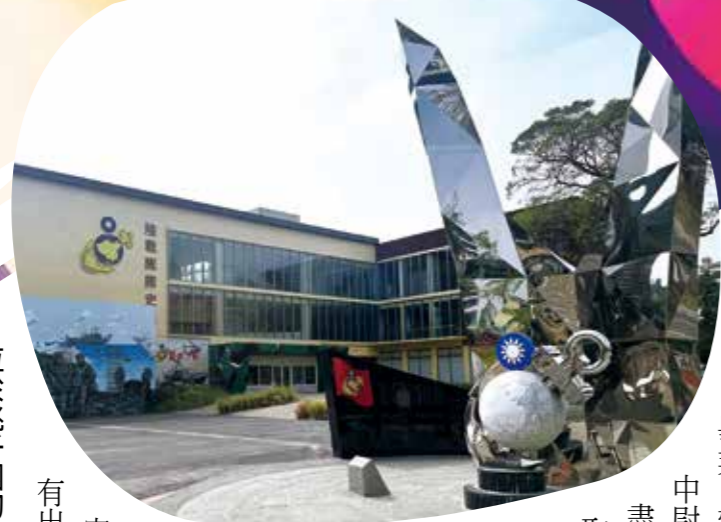
位於桃子園的陸戰隊隊史館，保存及展示陸戰隊輝煌歷史。