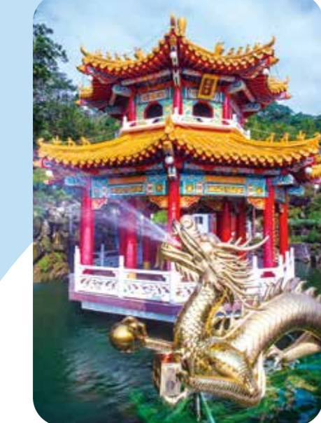
指南宮在貓纜指南宮站旁設有迎仙亭，歡迎遊客。

貓空纜車 簡稱「貓纜」，位於臺北市文山區，即捷運文湖線的終點站，是極具特色的旅遊交通工具，搭乘貓纜不僅可自空中遠眺沿線風光，還可以順遊沿線三個極具特色的景點，包括臺北市立動物園、指南宮和貓空，交通方便，旅遊內容豐富且具知性，適合家人、親子、好友共遊。 貓纜之眼俯瞰山林美景 貓空纜車全線長約四公里，設有四個車站，分別是動物園站、動物園南站、指南宮站和貓空站。當纜車慢慢升空，臺北市的繁華景象漸漸遠去，取而代之的是翠綠的茶園和山巒，可謂風景如畫。最特別的是，部分纜車車廂擁有強化透明玻璃地板，稱為「貓纜之眼」水晶車廂，搭乘時可以俯瞰腳下的山林美景。