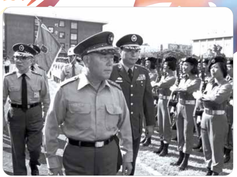
民國七十四年，參謀總長郝柏村上將（左前）檢閱參加國慶慶行的三軍官校與政戰學校學生隊伍。

行政院前院長郝柏村在民國一〇九年三月逝世時，我很傷心。葬禮由當時國防部部長、現在擔任輔導會主任委員嚴德發先生主持，儀式莊嚴隆重，令人感動。