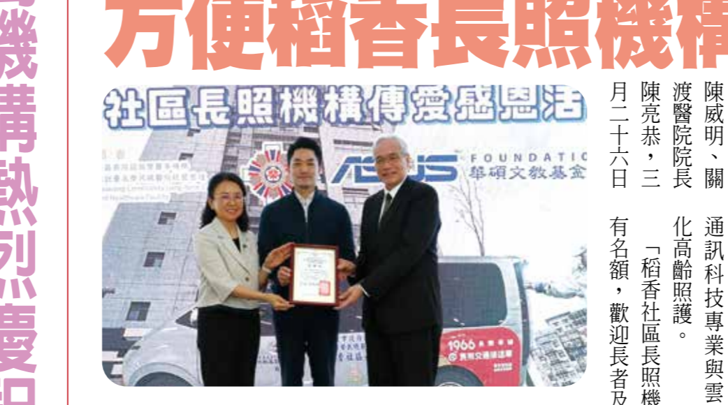
臺北榮總院長陳威明(右)向華碩文教基金會執行長魏杏娟(左)致贈感謝狀，中為臺北市長蔣萬安。

【本刊訊】華碩基金會執行長魏杏娟表示，該基金會也捐贈臺北榮總一批手持式超音波，搭配資通訊科技專業雲端服務，強化高齡照護。