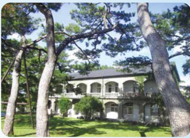
▲松園別館四周綠草如茵，老松環繞，療癒感滿滿。

直到民國三十六年改由國軍駐守，後來又成為「美軍顧問團軍官休開渡假中心」，六十六年改由國有財產局所有，六十七年交由輔導會管理，九十一年被公告登錄為歷史建築，至今仍是花蓮縣僅存日據時期最完整的一棟軍事建築。