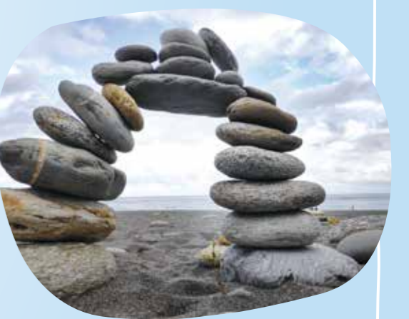
▲七星潭有「疊石傳說」，聽說只要疊起七顆以上的石頭，感情就會受到祝福，能長長久久。

海岸景點二：四八高地曼波園區 平視完七星潭，想來點更不一樣的視角，可以前往附近的四八高地曼波園區，這裡除了有大大小小漫遊花園可以走走逛逛，也是眺望七星潭海岸的絕佳制高點，只要稍微爬坡登頂，站上觀景臺，俯瞰整個七星潭海灣的那一刻，絕對會被遼闊的絕美視野所震撼。