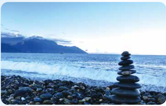
▲七星潭為瀕臨太平洋的弧形海灣，由大大小小的礫石所鋪陳。

海岸景點一：七星潭 說到花蓮的經典美景，七星潭絕對是必訪之地。這是一個月牙弧形海灣，不同於其他沙灘，七星潭沙灘上布滿的都是被海浪打磨過的鵝卵石，遊客來到這裡，就算只是靜靜地坐在沙灘上，看著遠方碧海藍天放鬆、放空，聽著海浪拍打聲音，就很療癒，然後再來玩個石頭疊疊樂，看誰的手最穩，能疊得最高，有趣又紓壓。