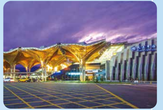
▲花蓮火車站以燈光裝飾，在夜空中相當璀璨。

春 天的暖陽下，很適合出門旅行，難得的周末假日該去哪裡走走呢？不如，就走走一趨花蓮吧！ 由於發生在去年的○四○三大地震，花蓮受到重創，觀光旅遊也面臨嚴峻考驗，但花蓮得天獨厚的自然美景和豐富多樣的人文孕育，總是讓人忍不住想去走訪，親眼看看那湛藍迷人的七星潭、探訪別具歷史意義的松園別館、還有到東大門夜市嘗鮮，大飽口福，這次的旅程我們就先不走太遠，只踩點幾個花蓮市區和鄰近的景點，來趟輕鬆悠活的小旅行吧！