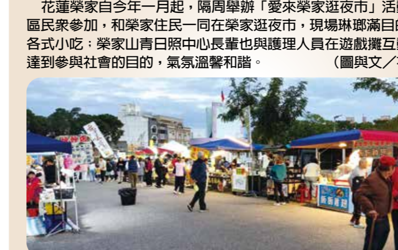
花蓮榮家自今年一月起，隔周舉辦「愛來榮家逛夜市」活動，邀請社區民眾參加，和榮家住民一同在榮家逛夜市，現場琳瑯滿目的攤位提供各式小吃；榮家山青日照中心長輩也與護理人員在遊戲攤互動，讓長輩達到參與社會的目的，氣氛溫馨和諧。

【本刊訊】大甲媽祖在中部遶境期間，彰化縣和雲林縣榮服處結合地方資源，在遶境路線旁，設置為榮民（眷）祈福的愛心補給站，提供信眾免費點心及飲料，傳遞溫暖與幸福。 今年的大甲媽祖遶境活動，於四月四日晚間自臺中市大甲區鎮瀾宮起駕，沿途駐駕彰化市南瑤宮、西螺鎮福興宮、新港鄉奉天宮、北斗鎮奠安宮、彰化市天后宮、清水區朝興宮，最後於四月十三日回鑾大甲區鎮瀾宮，全程九天八夜，有萬名信眾徒步三百多公里隨行，沿途有很多民眾為遶境隊伍提供點心、食宿等服務。 彰化縣榮服處在彰化藝術館前設置「大甲媽祖香客愛心補給站」，雲林縣榮服處在元長鄉保勝宮前設置補給站，提供免費點心與飲品，令許多信徒感到非常親切，紛紛舉手比「讚」。