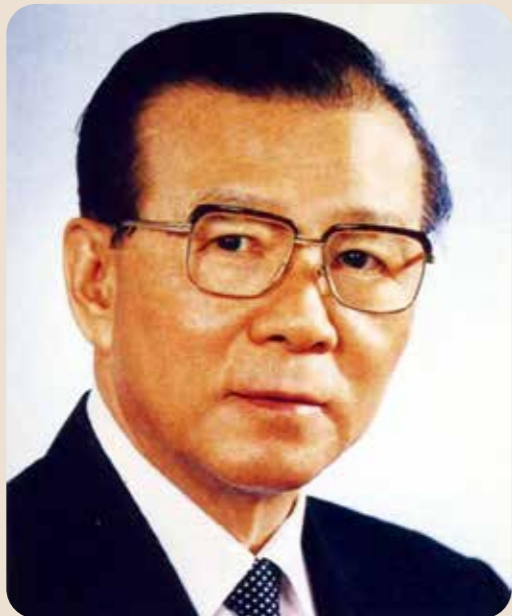
許歷農上將擔任輔導會主委期間，貢獻良多。