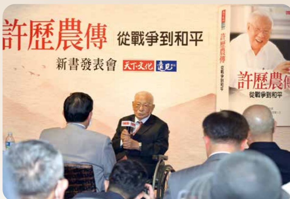
《許歷農傳——從戰爭到和平》新書發表會中，一〇四歲高齡的許歷農上將出席致詞。

募款五億 助兩萬榮民返鄉 此外，他配合政府開放大陸探親政策，籲請各界籌募旅費五億餘元，也積極規劃配套措施，協助二萬多位榮民達成返鄉探親心願，使榮民探親之路更加順暢。 民國八十一年十一月奉行政院核定實施「就養榮民申請進入大陸地區就養給付發給辦法」，且因應地區榮民(眷)及一般民眾的醫療需要，籌建桃園、鳳林及臺東等三所榮院。 另外，他積極推行所屬農業、事業機構「團結致富」方案，倡導發展精緻農業、促進農業升級，鼓勵農場種植經濟價值較高的農作物，提高農民生活品質與收益。並配合政府發展觀光休閒政策，完成森林開發處樓閣山及武陵、福壽山、清境、嘉義農場等地區的整體觀光規劃，持續推廣之下，上述諸地儼然成為國內最具盛名的觀光景點。 民國八十二年二月，許老爹卸五年多的主委一職，後來他在「遠見·天下文化事業群」出版的《許