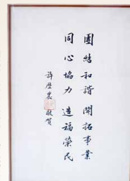
許歷農上將親筆致賀。

歷農傳——從戰爭到和平》書中寫下：「我在能力範圍裡已盡心盡力了，希望沒有辜負經國先生託付。」 輔導會暨榮民 永懷許老爹 輔導會十分尊敬前主委許歷農上將，例如民國一〇四年出版《不朽的戰魂》新書發表會時，邀請此書受訪者許老爹等出席；民國一〇七年，許老爹百歲華誕時，輔導會為他慶生。 一〇一二年《許歷農傳——從戰爭到和平》一書出版，輔導會除了出席新書發表會，又訂購一百本，發給輔導會的幹部，期能向「許老爹」學習。民國一〇二年，輔導會特別敬頒許老爹「二等榮光專業獎章」。 一〇一三年五月，現任主委嚴德發剛上任，就去探望許老爹，向老人家致敬。今年，臺北榮總又為住院療養的許老爹慶祝一〇七歲華誕。