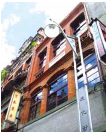
大稻埕商團以迪化街為核心發展，中藥、南北貨商店林立。

【記者郭榮芳／專題報導】坐落臺灣各地的老街，橫跨一兩個世紀，積累幾代人的共同回憶。透過平凡巷弄裡重生的建築、亭仔腳（騎樓下）遠近馳名的小吃、一甲子歲月的老店，正延續編織老街的種種故事，勾勒昔日的繁華。 本期介紹具有巴洛克風味的四處老街，讓我們一同尋訪，體驗老街的人文歷史，品嘗當地特產，享受都市喧囂外的懷舊心情。