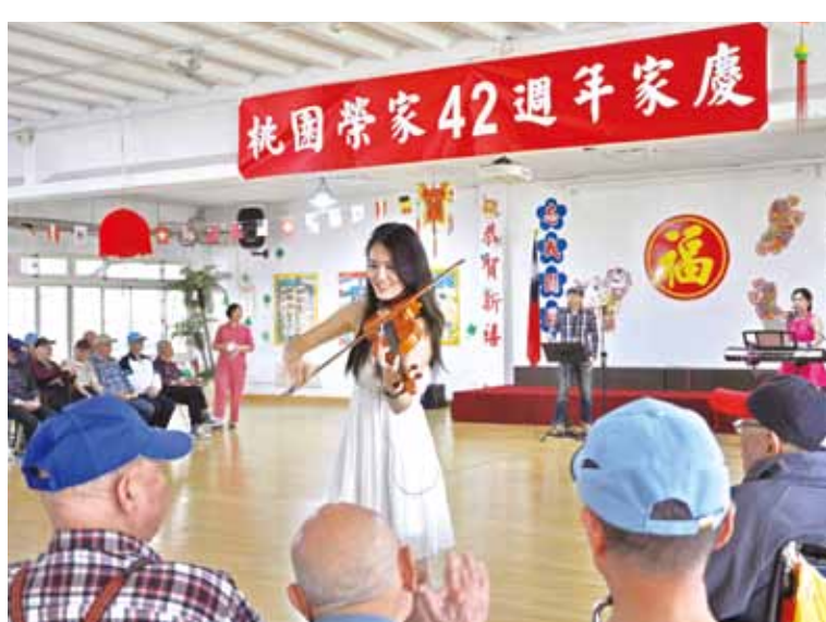
桃園榮家四十二週年家慶中演唱老歌、演奏小提琴，讓長輩們一起開心慶祝榮家生日。

入館後，榮民長輩被館內豐富的各式飛機、戰機及裝備展示內容吸引，隨著解說員的引導，彷彿進入時光隧道，包括空軍裝備的沿革、教練機、偵察機、戰鬥機及總統專機等，長輩們專注地聽講各戰機參與的戰役及戰功，經一個多小時的參觀，伯伯們表示大開眼界，也不吝分享自己的參戰經歷，直說有機會還要再來看看。 陳主任表示，透過自強活動讓榮民伯伯走出戶外，心情開朗，渾身舒暢，日後也會持續辦理戶外活動，讓伯伯們樂活「銀」向人生。