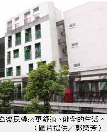
煥然一新的板橋榮家，為榮民帶來更舒適、健全的生活。

【本刊訊】臺東馬蘭榮家日前經衛福部國民健康署通過認證為「高齡友善健康照護機構」，成為臺東縣境中第一個通過認證的社福機構。 馬蘭榮家表示，上述認證是由國民健康署聘請專家、學者擔任審查委員，進行書面查證與實地勘查作業後完成。根據經建會人口資料調查，臺灣已逐漸邁入「高齡化社會」，六十五歲老年人口在一〇七年時將占總人口的百分之十四，一四一四年時更會超過百分之二十。 為及早因應高齡化社會到來，馬蘭榮家透過國民健康署「臺灣高齡友善健康照護機構認證」的架構，以提升長者健康、 尊嚴與參與為願景，來營造友善環境，使長輩能安心入住，擁有健康快樂的晚年生活。