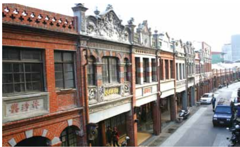
三峽老街巴洛克飾牆、紅磚拱廊，令人發思古之幽情。