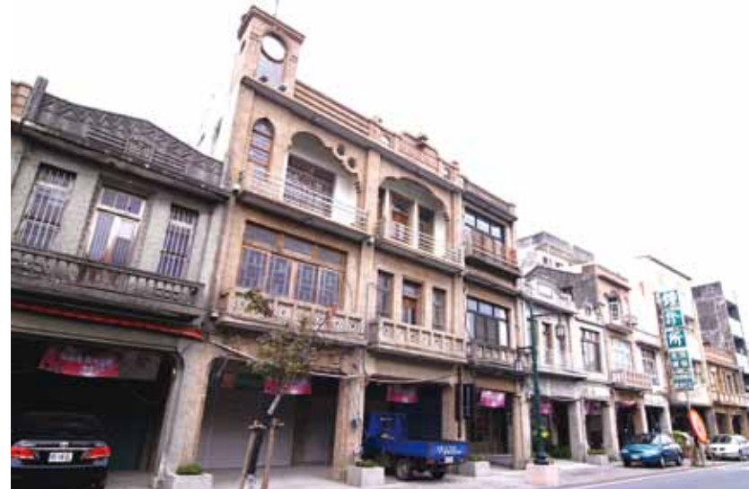
金玉成商會突出的鐘樓，是西螺老街重要的地標。