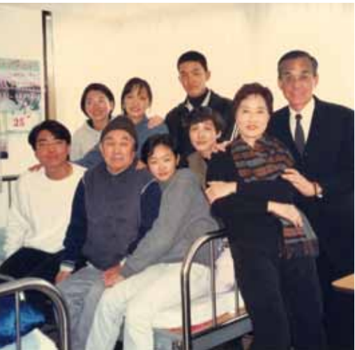
作者（後右一）與父親（前左二）、家人合影。

楷模」表揚。七十六年我升上校十年，萌退伍之意，但家父說：「你和啟鵬夫婦倆，皆國家培育，現均為上校，夫復何求？若錢不夠用，可將每月侍奉父母的養老金停止。」我立即領訓認錯，打消退伍之念。