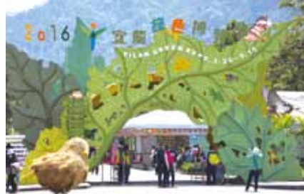
每年綠博都吸引大小朋友的目光。

宜蘭綠色博覽會—— 以農業生活、生態保育、永續未來為主軸的綠色博覽會，已於三月二十六日在蘇澳武荖坑園區熱鬧展開。綠意盎然的園區共分「漂流森林」、「特拉吉斯」、「拾棄時代」、「糧心聚落」、「農林祕境」五大展區，透過體驗活動，寓教於樂，深具意義。 ●日期：三月二十六日至五月十五日。 ●地點：武荖坑風景區（宜蘭縣蘇澳鎮武荖坑路七五號）。 ●門票：入場（六十五歲以上長者免費）。 ●網路： http://www.greenexpo-land.gov.tw ●服務電話：(03) 9955100。 ●臺中媽祖國際觀光文化節——每年農曆三月大甲媽祖遶境進香活動，是全國最大的宗教盛事。「二〇一六臺中媽祖國際觀光文化節」結合臺中十二座百年媽祖宮廟遶境與祭典活動，並規劃有一系列精彩的藝文、歌仔戲、陣頭等展演。 ●日期：二月十二日至五月二十八日。 ●地點：新社九庄媽、大甲鎮瀾宮、南屯萬和宮、大庄浩天宮、臺中樂成宮、梧棲朝元宮、臺中萬春宮、豐原慈濟宮、社口萬興宮、大里代福興宮、北屯南興宮、大肚萬興宮。 ●網路： http://www.chenyl100.com.tw/2016tmazu/index.php ●活動詳情可電洽：(04) 23892342 轉 35410。(郭榮芳)