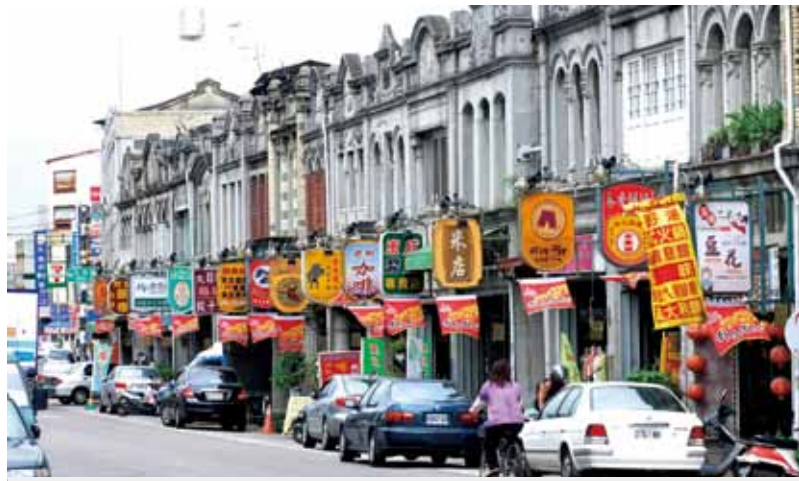
新化老街的立面保存了昔日意象，見證當地早年的繁華歷史。