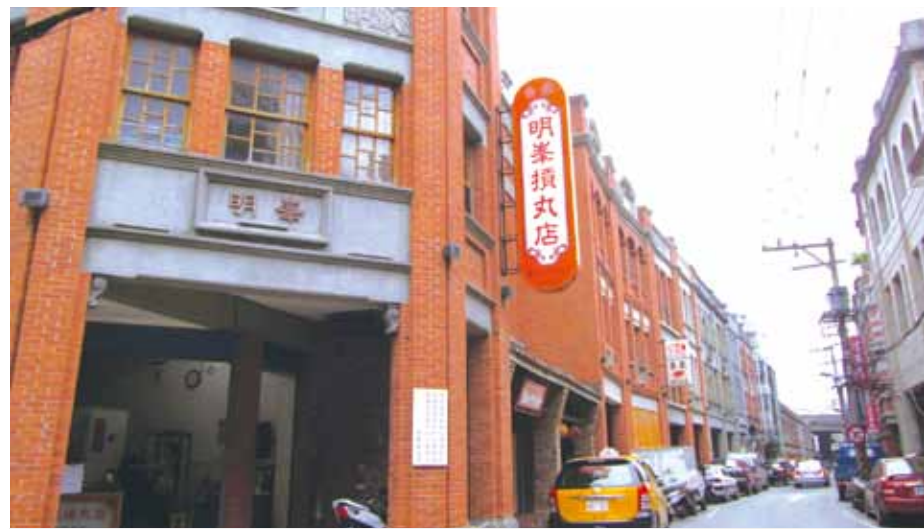
走進大稻埕，宛如進入歷史長廊，人文建築一一展現。

【記者郭榮芳／專題報導】坐落臺灣各地的老街，橫跨一兩個世紀，積累幾代人的共同回憶。透過平凡巷弄裡重生的建築、亭仔腳（騎樓下）遠近馳名的小吃、一甲子歲月的老店，正延續編織老街的種種故事，勾勒昔日的繁華。 本期介紹具有巴洛克風味的四處老街，讓我們一同尋訪，體驗老街的人文歷史，品嘗當地特產，享受都市喧囂外的懷舊心情。