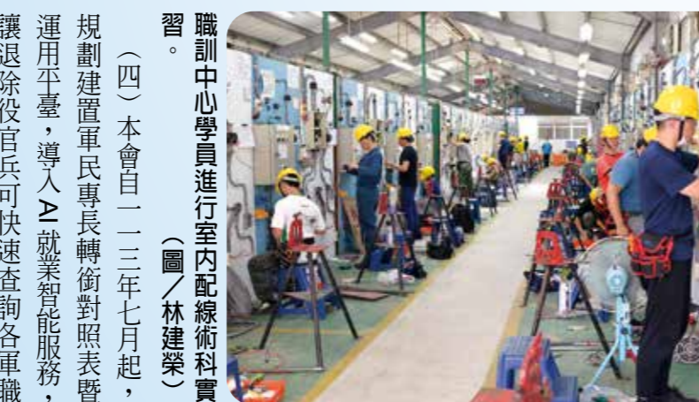
職訓中心學員進行室內配線術科實習。

（四）本會自一三二七年七月起，規劃建置軍民專長轉銜對照表暨運用平臺，導入「就業智能服務」讓退除役官兵可快速查詢各軍職專長適合轉銜之民間職業；一三三年已完實施計畫訂定，成立跨部會專案推動工作小組及整合勞動部、經濟部與教育部意見，擬定作業內容等，一四四年已完預算檢討編列及採購作業，於五月一日外建置對照表，全案預計於一六年一月一日啟用。