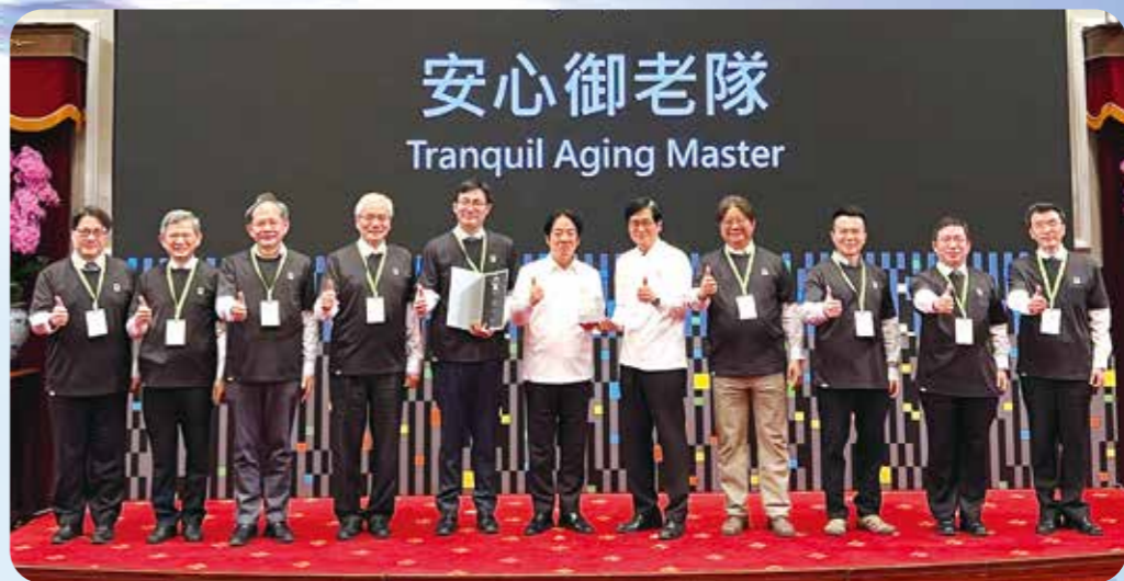
安心御老隊 Tranquil Aging Master

輔導會為主的「安心御老隊」獲選總統盃黑松「卓越團隊」，主委嚴德發（右五）偕團隊與賴總統（中）合影慶祝。