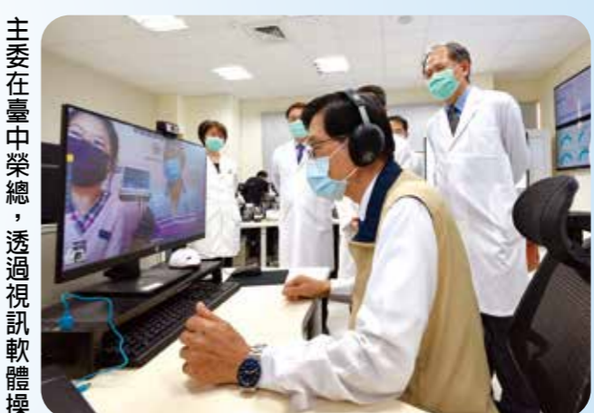
主委在臺中榮總，透過視訊軟體操作，了解雙向遠距醫療諮詢服務執行情形。

一五年預計將全數竣工。 （二）隨著邁入超高齡社會，應對人口結構變遷帶來的挑戰，各榮家已提供餘裕床位予一般民眾自費入住，未來可望提供更多元服務。榮家開放一般民眾床位數一六九一床，占床數一四六四床（占床率八六·五八%）。