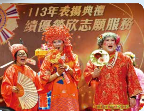
績優榮欣志願服務表揚活動中，志工精采演出。（圖／林建榮）

（一）面臨高齡及失智人口急速攀升時代，推動「提升失智照顧量能長照忘我園區」中程計畫，使榮家成為全國結合安養、護理及失智照顧最優質的綜合型機構，本會一〇九至一五五年計畫逐步建置六所榮家失智床位：板橋（一三〇床）、八德（九十九床）、彰化（三三六床）、雲林（九十六床）、高雄（九十六床）、馬蘭（四十八床），俟建置完成後，將增加失智床位五〇二床，失智總床位數可達一四四五床。