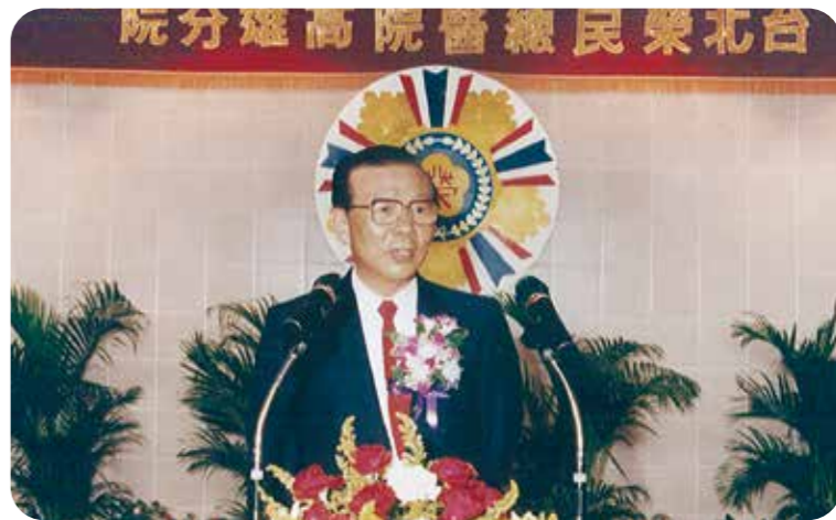
民國七十九年十月三十一日，許歷農前主委主持臺北榮總高雄分院開幕典禮。

每 天到車水馬龍的高雄市民族路、大中路口的高雄榮總上班，常會想當初院址怎麼會選到這裡？是考量了什麼？我特別從舊檔案之中，翻到一些或許早被遺忘的故事。