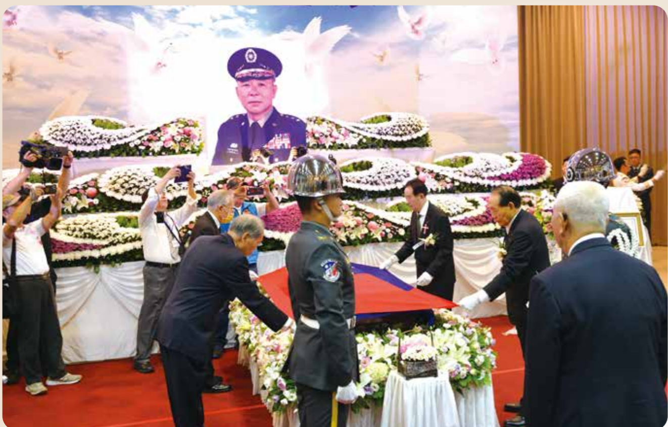
國防部前部長伍世文、三軍大學前校長夏瀛洲、陸軍前總司令陳鎮湘、國防安全研究院董事長霍守業等四位上將擔任國旗覆旗官，為許前主委靈柩覆蓋國旗，表達敬意。