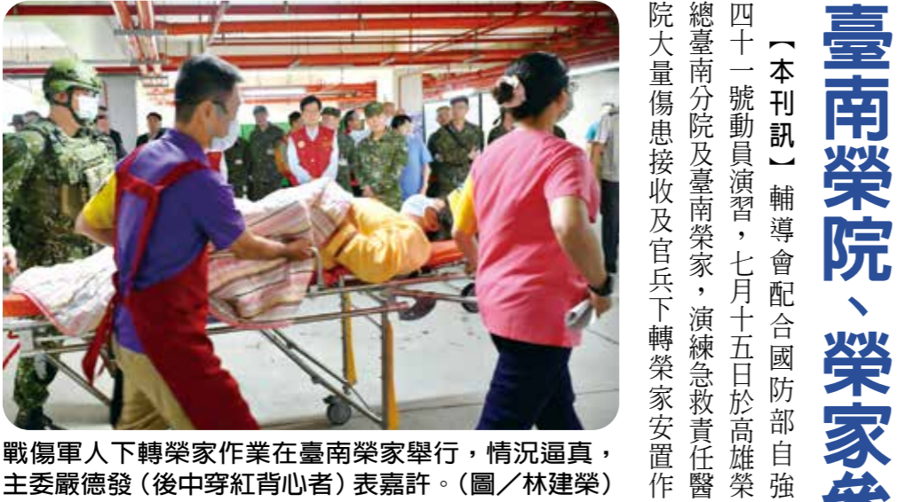
戰傷軍人下轉榮家作業在臺南榮家舉行，情況逼真，主委嚴德發（後中穿紅背心者）表嘉許。