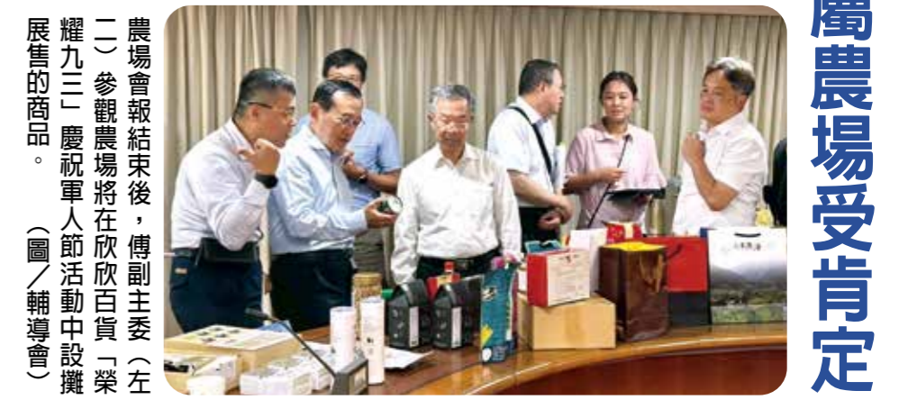
農場會報結束後，傅副主委(左二)參觀農場將在欣欣百貨「榮耀九三」慶祝軍人節活動中設攤展售的商品。

【本刊訊】輔導會七月三十日舉行一四年度第二季農場工作會報，副主委傅正誠表示，除了希望營收一年比一年好，更期盼農場多辦公益活動，強化公益形象，以福壽山農場協助改善一〇三歲獨居榮民張天佑爺爺居住環境為例，即獲得社會正面評價，這是非常成功的做法，也是會屬農場所應負的社會責任。 承辦的事業管理處在會中報告農場營運情形；清境、武陵、福壽山、彰化、臺東五大農場場長說明各農場相關工作；會中還聽取「榮耀九三」慶祝軍人節活動農場設攤規劃，及故宮聯名商品合作規劃案，相關樣品並在會場展示。 交通部觀光署第二屆「觀光亮點獎」第一階段網路票選活動，七月三十一日截止投票，武陵農場是中部組唯一突破四萬票的景點，清境農場、福壽山農場緊追在後，囊括前三名，充分顯示民眾對會屬農場的肯定與歡迎。