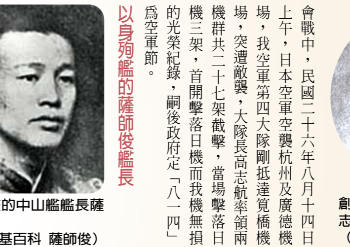
以身殉艦的中山艦艦長薩師俊。(圖/維基百科 薩師俊)

會戰中，民國二十六年八月十四日上午，日本空軍空襲杭州及廣德機場，我空軍第四大隊剛抵達寬橋機場，突遭敵襲，大隊長高志航率領兩機群共二十七架截擊，當場擊落日機三架，首開擊落日機而我機無損的光榮紀錄，嗣後政府定「八一四」為空軍節。