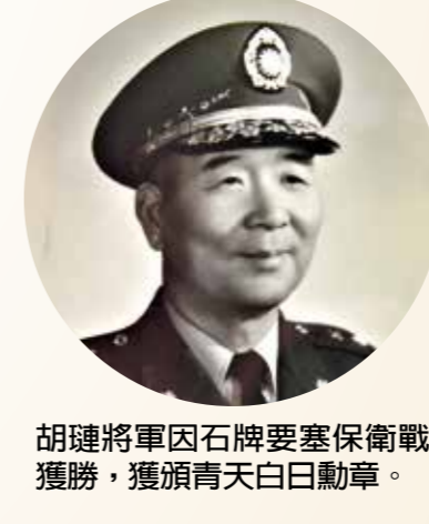
胡璉將軍因石牌要塞保衛戰獲勝，獲頒青天白日勳章。

胡璉將軍的孫子胡敏越先生表示：民國三十三年，日軍決定發動「鄂西會戰」，攻占四川門戶的石牌要塞，以進窺我抗戰陪都重慶，企圖結束對華戰爭。中華民國的存亡在此一役，我國決定不惜代價保衛石牌。