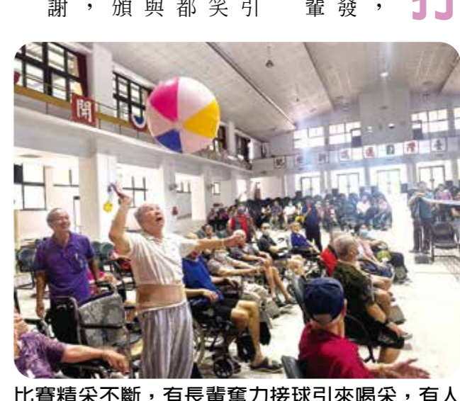
比賽精采不斷，有長輩奮力接球引來喝采，有人幽默失誤惹得全場發笑。