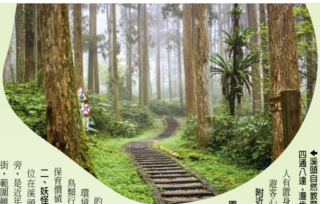
溪頭自然教育園區古木參天、林道四通八達，漫步其間猶如置身畫境。