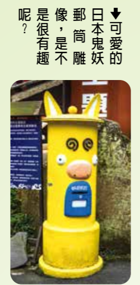
可愛的日本鬼妖郵筒，是很有趣呢？ 龍瀑布 小木屋、套房 與露營場地：花卉中心 種植滿天星、繡球花與

位於南投縣鹿谷鄉，係臺灣大學農學院實驗林之一，區內遍植杉、柏、紅檜、銀杏、孟宗竹等，古木參天，林道四通八達，遊客可以一邊遊覽，一邊享受森林浴。園區內陳列館、標本園、大學池、神木、孟宗竹林等，均適合進行有系統的生態觀察活動。