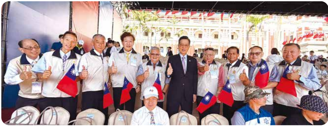
輔導會主委嚴德發(右五)與榮民楷模代表於觀禮臺合影，祝中華民國生日快樂。

與榮民楷模代表於觀禮臺合影，祝中華民國生日快樂。國慶大會，於觀禮臺全程參與，輔導會今年選出的十六位榮民楷模中，也有八位應邀出席，分別是新北市吳文進、桃園市黃信雄、臺中市姚約翰、新竹市阮慶華、嘉義縣湯宏忠、苗栗縣吳光祐、彰化縣陳任昇、南投縣王生富。榮民楷模們表示，能在雙十國慶當天登上總統府前觀禮臺，共同見證國家慶典，倍感光榮與振奮。感謝輔導會貼心安排，讓榮民楷模在國家最重要的日子受到禮遇與肯定。