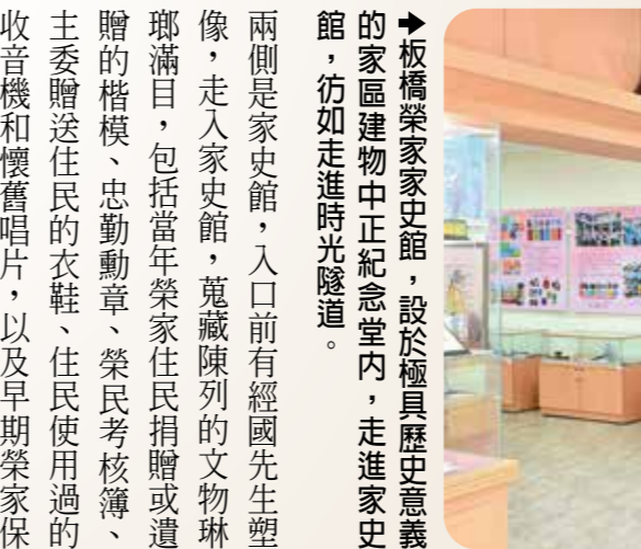
板橋榮家家史館，設於板橋歷史意義的家區建物中正紀念堂內，走進家史館，彷彿走進時光隧道。