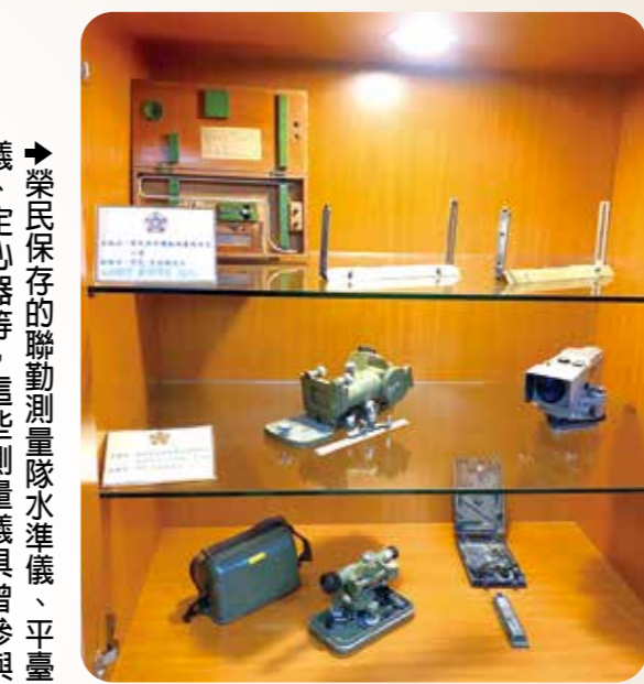
榮民保存的聯動測量隊水準儀、平量儀、定心器等，這些測量儀器曾參與開闢東西橫貫公路和十大建設。

十月三十一日是榮民節，輔導會及會屬各機構都有盛大慶祝活動，感念榮民前輩們在風雨飄搖的年代，用自己的青春歲月，捍衛國家人民安全。他們曾是沙場戰士，如今是榮譽國民，在榮民節前夕，走訪輔導會及會屬機構，參觀所典藏的榮民文物，讓我們向每一個奮鬥的身影，每一片奉獻的心致敬。