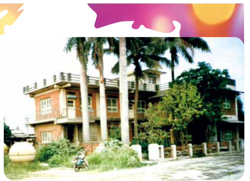
紅樓一開始是王家自行設計建造居住，後來曾作為工務室、院史館、洗衣部、理容院等場所使用（上圖）。現在的紅樓主要用途是「社區復健中心」（下圖）。