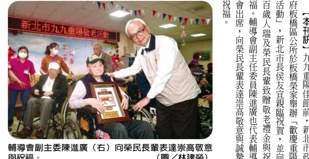
輔導會副主委陳進廣（右）向榮民長輩表達崇高敬意與祝福。

【本刊訊】九九重陽佳節前，新北市政務處板橋區公所於板橋榮家舉辦「歡慶重陽活動」，新北市長侯友宜親臨祝賀，並向百歲人瑞及榮民長輩致贈敬老禮金與祝賀。輔導會副主委陳進廣也代表輔導會出席，向榮民長輩表達崇高敬意與誠摯祝福。 板橋榮家特派機器人「阿福」擔任迎賓工作，增添活潑與趣味，同時展示榮家智能照護的成效，長輩們笑容滿面、掌聲不斷。 活動由輔導會陳副主委、板橋榮家主任陳桂美及侯友宜市長先後致詞。陳副主委感謝榮民前輩為國家犧牲奉獻，使後輩得以安居樂業。輔導會將秉持「榮民在哪裡，服務就到哪裡」的精神，結合地方政府及社會資源，持續精進照顧與服務品質，讓榮民長輩得以健康快樂地安享晚年。 陳桂美主任表示，板橋榮家在輔導會支持與新北市政府指導下，積極打造低碳、永續且友善的長照環境，未來榮家將持續與市府合作，共同打造幸福、智慧、永續的安養家園。 侯市長頒發十五位人瑞金鎖片，包括一一〇歲陳延忠爺爺，象徵長壽與福氣，由榮家 SIGMA 機器人協助運送，展現智慧照護與科技融入長照服務的創新成果。隨後，市長與輔導會會長官共同為百歲人瑞獻上祝福，為重陽佳節增添滿滿的敬意與溫情。