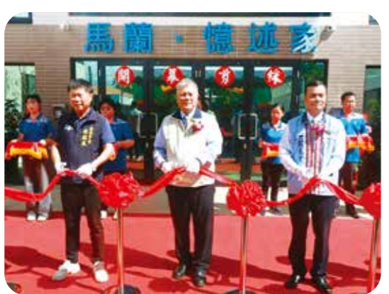
輔導會副主委吳志揚（中）、馬蘭榮家主任張揚興（前右一）等，為失智專區「憶述家」啟用剪綵。（圖／馬蘭榮家）

【本刊訊】慶祝榮民節及馬蘭榮家成立七十周年，並舉行馬蘭榮家失智專區「憶述家」開幕剪綵典禮，馬蘭榮家及臺東縣榮光會、輔導會副主委吳志揚於十月三十一日聯合辦理慶祝大會，輔導會副主委吳志揚於會中致詞，期勉同仁持續以專業與熱忱，服務榮民長輩，傳承榮家的榮耀與精神。 馬蘭榮家的失智專區統包新建工程，工程費新臺幣一億二三百萬餘元，於一十三年三月二十