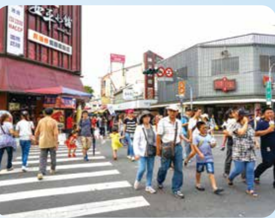
▲安平老街各式老店林立，國內外遊客在街上穿梭尋寶，非常熱鬧。

安平老街是荷蘭據臺時開闢的街道，巷弄狹窄僅供人行，是臺灣最古老的街區之一。街上老店林立，仍保留多棟古厝，並可見風獅爺、劍獅等特色裝飾。走入小徑、穿梭巷弄，彷彿時光倒流，是遊客漫遊尋寶的熱門景點。