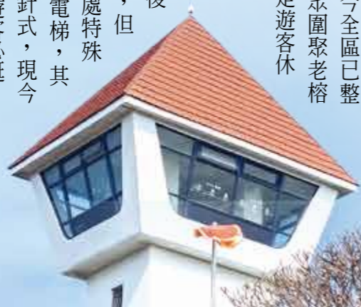
▲安平古堡的瞭望臺及鄭成功像，今昔映照，默默細訴著許多故事。

曾為日據時期百貨公司，重新開幕後以文創商品為主軸，但更引入入勝者為幾處特殊事物，包含流籠式電梯，其樓層顯示為旋轉指針式，現今非常少見。頂樓亦為遊客必逛，除參觀鳥居神社之外，因日軍曾在頂樓設置防空陣地，因此還有二戰末期美國軍機掃射痕跡，這些至今仍清晰留在牆上的彈孔，也讓遊客充滿時空凍結之感。