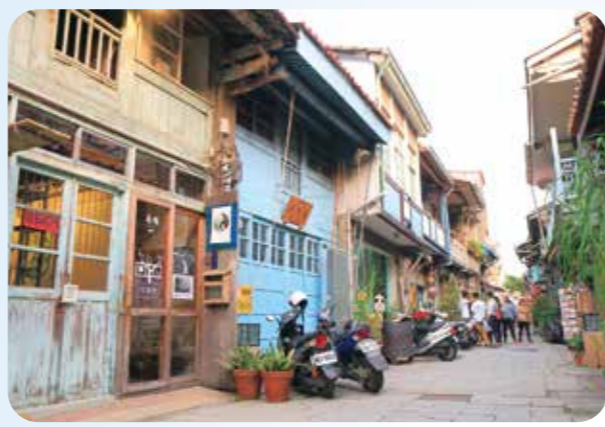
▲神農街近幾年成為文創藝術的集散地，為極具特色的文青聖地。