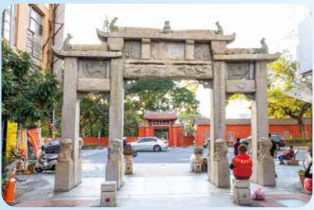
▲臺南孔廟的「泮宮石坊」，原本是出入孔廟的主要通道，四根石柱下方站了八隻小石獅，面朝中央，彷彿表示「歡迎光臨」。

創建於明代，至今已有一百餘年歷史，初設目的為開辦教育，培養為國效命人才。清代延續功能，為臺灣官辦的最高學府「臺灣府學」所在地。直到今日，孔廟在人們心中依然有著崇高的地位，每年九月二十八日孔子誕辰紀念日舉行釋奠典禮，祭孔典禮後滿滿人潮向偉大的孔老夫子求智慧，爭相上殿拔取智慧毛，是孔廟的一大盛事。孔廟作為臺南古都核心，串聯起舊街區及古蹟名勝，如大南門、府中街、延平郡王祠等，文化氛圍濃溢。