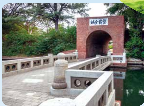
▲砲臺大門額書「億載金城」四字，城垣四周有護城河，林木茂密。

走 進臺南，彷彿打開一本本的歷史相冊，從斑駁的古堡，到香火鼎盛老廟與古色古香的巷道，處處訴說著臺灣的故事，本期就讓我們走進這座充滿記憶的城市吧！