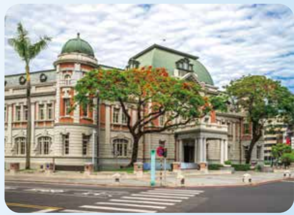
▲臺灣文學館採用馬薩式的建築風格，屋頂、大門口是歐日融合圓柱，展現典雅的建築美學。

臺灣文學發展從早期原住民族至今，世代更迭，族群交融，累積大量文學作品，孕育出豐厚多元的內涵。因此政府於民國九十二年成立該館，系統性蒐集、保存、研究珍貴文學資產。該館建築亦是擁有百年歷史的國定古蹟，前身為日據時期州廳，二戰後曾為空軍、臺南市政府所用，現今轉變為我國第一座國家級文學博物館，遊客可以透過觀賞各式展覽，