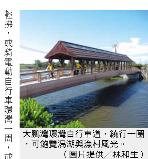
大鵬灣環灣自行車道，繞行一圈 ，可飽覽湖與漁村風光。

位於屏東東港的大鵬灣，原是林邊 溪及東港溪挾帶泥沙形成的潟 湖，政府於民國八十六年成立「大鵬 灣國家級風景區」，讓這有風無浪的 廣大水域，發展成可「海上漂」(如 帆船、獨木舟、天鵝船和風浪板等)， 及「陸地遊」(如環灣自行車、溼地、 漁村等)的濱海休閒度假勝地。