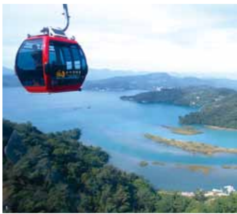
搭乘纜車，日月潭景致一覽無遺。

【第一天】臺中(搭臺灣好行巴士) ↓水社遊客中心(搭遊湖巴士)↓文 武廟↓松柏甯、大竹湖、水蛙頭步道 (搭遊湖巴士)↓日月潭纜車↓伊達 邵親水步道↓伊達邵碼頭(搭遊艇遊 湖)↓返回水社用餐、住宿。【第二 天】水社↓向山自行車步道↓水社纜 車↓向山遊客中心↓賦歸。