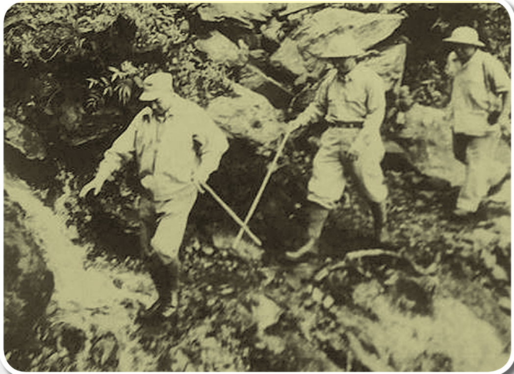
輔導會老主任委員蔣故總統經國先生(左)，帶領榮民兄弟履勘中橫路線。