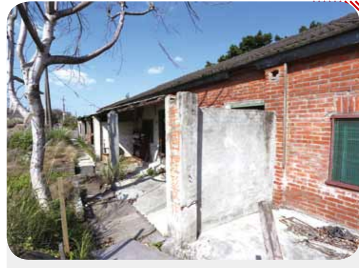
大華眷村已成廢墟，村旁的建國理髮店，徒留回憶。

壽星除了切蛋糕，還可獲紅包，全體加菜，每人發豆沙壽桃一個，同唱生日快樂歌為壽星祝賀，充分展現榮家是一個有尊嚴又溫馨的大家庭。 此處的服務人員訓練有素，且時常請專家來授課。他們見到榮民眷喊聲伯伯、阿姨，讓人打從內心感到舒服。晤談室有專門人員陪著聊天，提醒我們吃藥，更多時候陪著失智老人玩遊戲，一次又一次重複相同的話題，使他們回想從前，逗他們笑得合不攏嘴。 「戰時的生活很苦，婚後生活又很沉重，有什麼比現在過得還幸福？」我想這種幸福，不外乎是來自盡生命的坎坷後，享有平安自在的當下，所產生出淡泊名利，與世無爭，充實豐富的生活體驗吧！ 人生不過數十寒暑，最難熬的是老年孤獨寂寞，在榮家不怕沒有談話的對象，大家只要坐坐在一起，不論何時，都有聊不完的話題。在廣闊的綠蔭下，聽鳥鳴、看松鼠跳躍，藍天綠地，還有可愛的浮雲、燦爛的陽光相陪，使人心身舒暢，不但日子是好日，更是天天都開心。