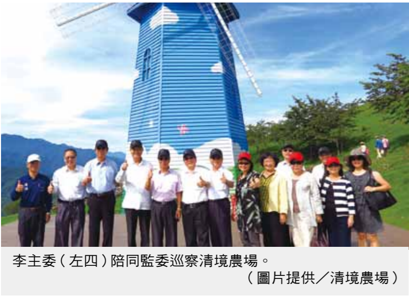
李主委（左四）陪同監委巡察清境農場。