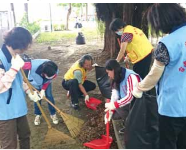
榮服處同仁與榮欣志化身環保小尖兵，清掃社區與公園環境。

【本刊訊】基隆市、苗栗縣及臺南市等三個榮服處，為了響應「六三三公共服務日」，職員與榮欣志紛紛出動，為社區打掃環境，以身體力行表達對鄉里的關懷，展現社區有愛、里仁為美的精神。 居住於基隆市和平退舍的單身榮民雖然不多，但因房舍老舊、廣場面積大，打掃不易，周邊溝渠容易孳生病媒蚊，為了給榮民伯伯乾淨、舒適的居住環境，基隆市榮服處協同陸軍三支隊運兵第二營、海軍基隆後支隊的弟兄及榮欣志們，合力前往打掃環境。 當天氣溫高達攝氏三十七度，榮服處職員及榮欣志早上九點到達和平退舍，隨即展開清掃環境、整理、消毒工作。為減少登革熱等病媒蚊侵害，大家認真在水溝及易積水容器裡噴灑殺蟲藥劑，陸軍三支隊運兵第二營弟兄則幫忙修復水電設施。