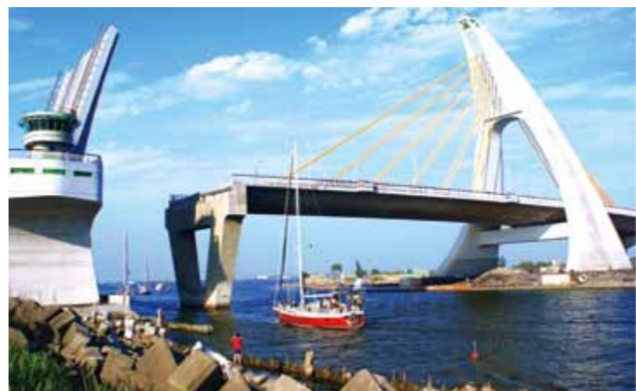
大鵬灣跨海大橋，每逢假日上演的開橋秀，總吸引遊 客駐足觀賞。

位於屏東東港的大鵬灣，原是林邊 溪及東港溪挾帶泥沙形成的潟 湖，政府於民國八十六年成立「大鵬 灣國家級風景區」，讓這有風無浪的 廣大水域，發展成可「海上漂」(如 帆船、獨木舟、天鵝船和風浪板等)， 及「陸地遊」(如環灣自行車、溼地、 漁村等)的濱海休閒度假勝地。