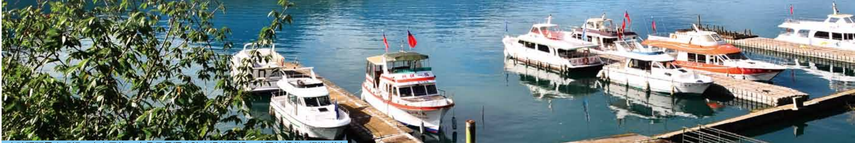
水社碼頭風光明媚，商家雲集，也是日月潭水陸交通的樞紐。

●交通部觀光局為擴大推動健康銀髮 族國人國內旅遊，旅行業得申請銀髮 族團員旅遊費用補助，每一銀髮族團 員每人每日最高新臺幣五百元。