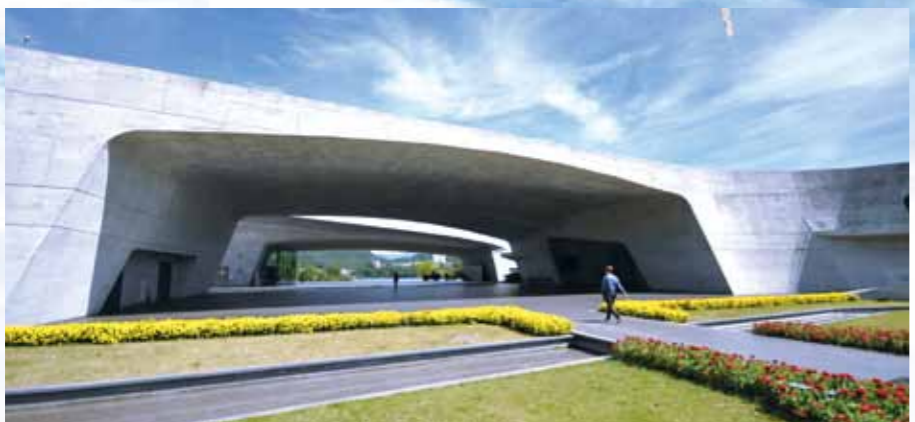
向山遊客中心，宛如拱手環潭的建築，充滿東方風情。

近年來，銀髮族旅遊已成 為旅遊市場必爭之地。這些年長者辛 苦一輩子，離開職場後，重視健康、養生、休 閒及心靈成長，於是衍生出不同型態的旅遊需求。 我們不妨從優遊、樂活、養生出發，透過安排合 宜的旅遊環境，提供友善的旅遊行程，多鼓勵長者 揪團外出走走，放鬆身心，進而能延緩老化，越活越 年輕，快樂過日子。