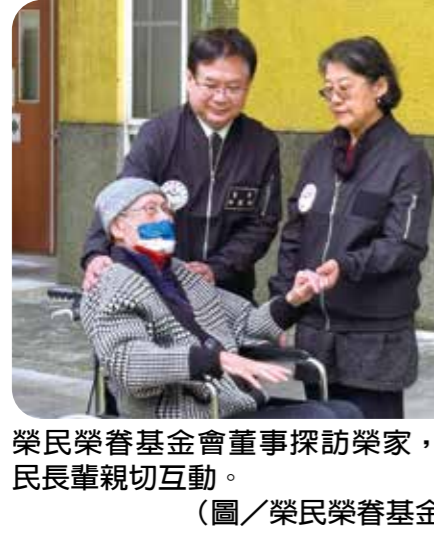
榮民榮眷基金會董監事探訪榮家，與住民長輩親切互動。