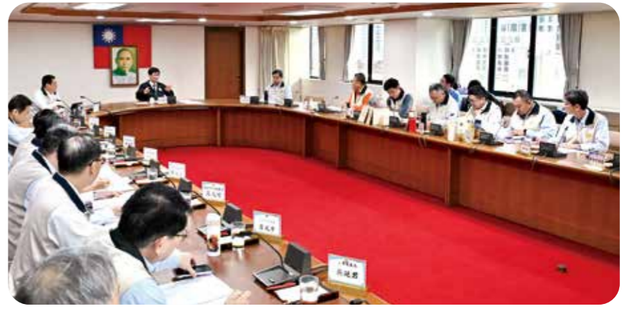
輔導會主委嚴德發(中)期勉各農場發揮特色，提升經營績效。

【本刊訊】會屬農場近期的經營逐步轉型，發展出兼顧農業生產與觀光休閒的多元經營模式，輔導會明年將邀請旅行社業者整合會屬各農場觀光資源，打造「退輔會觀光圈」品牌，強化國人對農場之品牌記憶。主任委員嚴德發十二月二日主持一四四年第三次農場工作會報時表示，期許各農場發揮特色，找到亮點，提升經營績效。 清境、武陵、福壽山、彰化、臺東五大農場場長出席會報，並說明各農場相關工作；承辦的事業管理處也在會中報告農場營運情形。