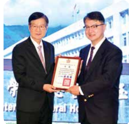
北榮玉里分院獲輔導會主委嚴德發(左)頒發「災害醫療救護有功獎」，由院長胡宗明(右)代表領獎。

依據事業處報告，在遊憩區經營方面，三高山農場一四四年迄今十月累計遊客數九十五萬五九八八人，較去年同期增加一萬五九四二九人，預估全年旅客可達一一九萬九千人，較去年增加約一萬五千人，期許各農場積極推廣行銷，以再增加旅客旅遊人次。 在農場品牌方面，農場與故宮博物院合作開發茶倉、茶糖、銀川米、肉鬆及保養品等二十二項聯名商品，目前正積極準備各項販售事宜。報告指出，藉由與故宮合作開發聯名商品，可提升各農場知名度，拓展各農場商品銷售管道，增進農場營收。 在觀光推廣方面，各農場一四四年辦理高山音樂會、櫻花季、奔羊節、採菊樂等特色活動，並推出聯合住宿優惠專案、軍人與軍校生、所屬員工等優惠專案，成功提升活動亮點並帶動觀光推廣。 國內行銷方面，計參加北、中、南地區旅展及二〇一四台北國際旅展；國外行銷計配合觀光署組團計畫，赴新加坡、馬來西亞、泰國及韓國等地參加國際觀光推廣活動，提升國際能見度。期許各農場持續規劃並推出具亮點活動，以強化旅遊推廣並吸引更多遊客參與。