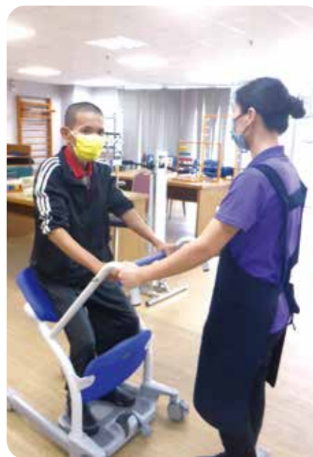
照顧人員使用「非動力站立移位輔助器」，推動長者移位。

【連線報導】為提升榮家長者的生活品質與健康照護成效，各榮家近來引進多項創新與實務並進的照護器材，並進行專業訓練，全面強化照護安全，提升住民自我照護及生活能力，也減輕第一線人員的工作負荷。 首先是板橋榮家統一聯標購置「非動力站立移位輔助器」，分配榮家使用，並於十一月四日在岡山榮家育愛堂辦理交貨與驗收，也為照顧服務員及護理人員舉辦教育訓練，使他們熟悉輔具操作，正確運用於住民照護與復健訓練。 非動力站立移位輔助器可協助能自行站立但無法行走者起身；可在安全無虞下進行站立訓練、移位及如廁；也可避免照顧者因攙扶而造成長輩腰椎受傷，同時減輕照顧員及護理人員的肌肉骨骼負荷。 另外，金屬工業研發中心與板橋榮家合作，導入「牙齒光照板」，並結合「台灣口腔照護協會」的衛教課程，展開為期半年的計畫，即拍攝五十三位住民，建立七一五筆口腔清潔影像資料庫，並導入「牙齒光照板」，將肉眼難以察覺的牙菌斑，以螢光或顯色方式清晰呈現，協助長者快速辨識清潔死角，並透過拍攝的前後對照，激發自我清潔動力。 佳里榮家和彰化榮家喜獲高雄立小港醫院捐贈「阻抗運動球」數十個，安排榮家住民與工作人員學習下巴內縮阻力運動(CTAR)，即將約十公分直徑的彈力球夾在下巴下方，進行等長收縮(夾住十秒)或等張運動(重複擠壓十次)，以增強吞嚥肌力。 研究顯示，在亞健康族群、老年肌力退化者中，CTAR運動可強化舌骨上肌與咽部相關肌群，促進吞嚥時的上提動作與食團通過咽部能力，建議每日執行三十次，一周五天，至少連續四周；現場榮家住民與工作人員跟隨語言治療師及教學影片示範，認真練習如何正確使用阻抗運動球。