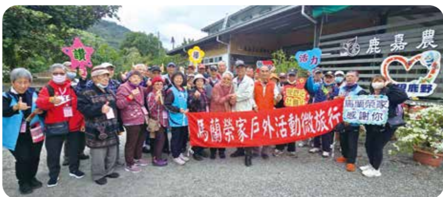
馬蘭榮家住民旅遊「鹿嘉農莊」，親近自然，豐富生活經驗。

【連線報導】雖是初冬，天氣不冷不熱，會屬機構紛紛安排住民外出遊覽，親近自然，豐富生活體驗。 馬蘭榮家於十二月三日舉辦「鹿野池上知性之旅」，首站來到鹿野鄉「鹿嘉農莊」，長者們開心體驗手作蛋糕，一邊捲起餅皮，一邊品嚐梅醋、靈芝醋與濃郁咖啡。下午走訪池上鄉大坡池，欣賞自然風光與人文故事。隨後前往「關山鎮米國學校」，參觀關山農會碾米作業陳展。 臺中榮總埔里分院附設護理之家「養樂居」舉辦秋遊活動，上午抵達魚池日照中心，展開社區適應及「艾草薰香手作」活動。下午前往日月潭水社碼頭，包下電動遊湖船遊潭。從水社碼頭至玄光碼頭，沿途由專人全程導覽涵碧半島、拉魯島、山光水色等地標，讓住民欣賞湖光山色，也了解日月潭的人文故事。 花蓮榮家辦理「秋饗縱谷」自強活動，首先抵達吉安鄉的好客藝術村，沉浸在在地客家文化中，再參訪吉安鄉農會山海正甜製冰所，品嚐文創經典美食。第三站到台灣兒童發展協會馬匹輔助教育中心，體驗馬匹餵食與引領，許多長輩開心不已。下午前往「理想大地」，摩洛哥建物風情令長輩讚嘆連連，湖畔美景宛如置身歐洲。 屏東榮家帶領長輩參觀農業科技園區「觀賞水族展示廳」，長輩們看見色彩繽紛的魚類及活潑的蝦類，興致盎然地在展示缸前駐足欣賞。長輩們開心表示：「好久沒這麼近距離看魚了，不免想起以前在家鄉抓魚、釣魚的經驗。」現場氣氛熱烈，喚起年輕時的回憶。