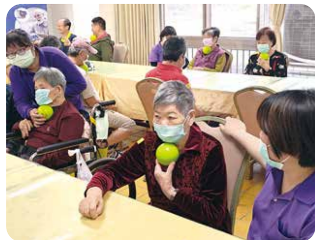
榮家住民使用阻抗運動球進行下巴內縮阻力運動，以增強吞嚥肌力。

【連線報導】為提升榮家長者的生活品質與健康照護成效，各榮家近來引進多項創新與實務並進的照護器材，並進行專業訓練，全面強化照護安全，提升住民自我照護及生活能力，也減輕第一線人員的工作負荷。 首先是板橋榮家統一聯標購置「非動力站立移位輔助器」，分配榮家使用，並於十一月四日在岡山榮家育愛堂辦理交貨與驗收，也為照顧服務員及護理人員舉辦教育訓練，使他們熟悉輔具操作，正確運用於住民照護與復健訓練。 非動力站立移位輔助器可協助能自行站立但無法行走者起身；可在安全無虞下進行站立訓練、移位及如廁；也可避免照顧者因攙扶而造成長輩腰椎受傷，同時減輕照顧員及護理人員的肌肉骨骼負荷。 另外，金屬工業研發中心與板橋榮家合作，導入「牙齒光照板」，並結合「台灣口腔照護協會」的衛教課程，展開為期半年的計畫，即拍攝五十三位住民，建立七一五筆口腔清潔影像資料庫，並導入「牙齒光照板」，將肉眼難以察覺的牙菌斑，以螢光或顯色方式清晰呈現，協助長者快速辨識清潔死角，並透過拍攝的前後對照，激發自我清潔動力。 佳里榮家和彰化榮家喜獲高雄立小港醫院捐贈「阻抗運動球」數十個，安排榮家住民與工作人員學習下巴內縮阻力運動(CTAR)，即將約十公分直徑的彈力球夾在下巴下方，進行等長收縮(夾住十秒)或等張運動(重複擠壓十次)，以增強吞嚥肌力。 研究顯示，在亞健康族群、老年肌力退化者中，CTAR運動可強化舌骨上肌與咽部相關肌群，促進吞嚥時的上提動作與食團通過咽部能力，建議每日執行三十次，一周五天，至少連續四周；現場榮家住民與工作人員跟隨語言治療師及教學影片示範，認真練習如何正確使用阻抗運動球。