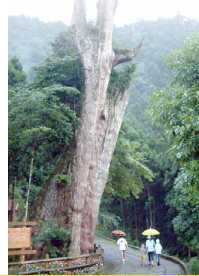
明池森林遊樂區的步道林木密布，相當清幽。