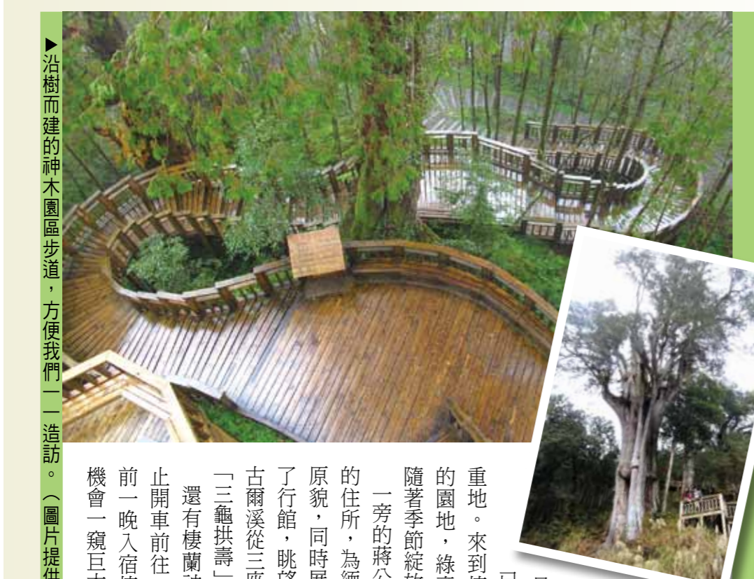
▶沿樹而建的神木園區步道，方便我們一一造訪。

臺灣生態之美——農場保育類鳥類介紹 在輔導會所轄的農場中，有著豐富的生態，尤其多變的環境與豐沛的食物，更是鳥類絕佳的棲地，以下介紹三種臺灣特有鳥類，您到訪遊樂區時別忘了捕捉牠們的身影，但勿侵擾瀕臨絕種的牠們。