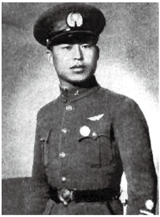
空戰英雄高志航。

十一月，高志航率四大隊赴蘭州接收俄機，十五日，率俄製飛機 F11G 等十三架飛抵周家口，因天氣不佳留場待命。至廿一日，天氣轉晴，正準備當日飛回南京，忽傳警報，日機自長