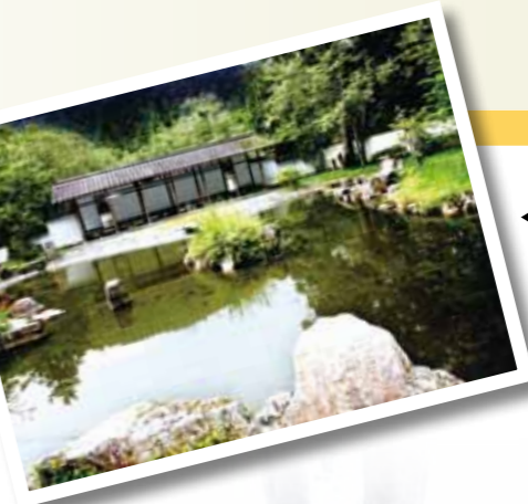
▲富春庭，庭中有奇石、池水、長廊、綠林，景色清幽宜人。

漫步池邊，總能見到天鵝、綠頭鴨、鸕鶿等，優遊在倒映著山光風影的湖面，這些雁鴨因常年接觸遊客，非但不怕人，反而與人非常親近，常伴隨著遊客環湖，共賞曼妙美景。園區除了湖泊，還委託名設計師以「園林山水」手法，搭配小橋流水、亭榭樓閣，陸續規劃出三處庭園，如故總統經國先生的明池別館「慈園」，在其中搭建「慈亭」，以紀念母親毛太夫人的撫育深恩，因位處高點，天氣晴朗時亦可看見明池全景。