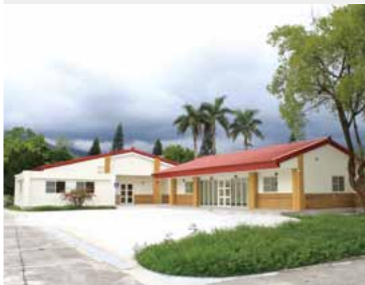
▲三合院造型的池上榮民會館，遠離塵囂，坐落田園間。