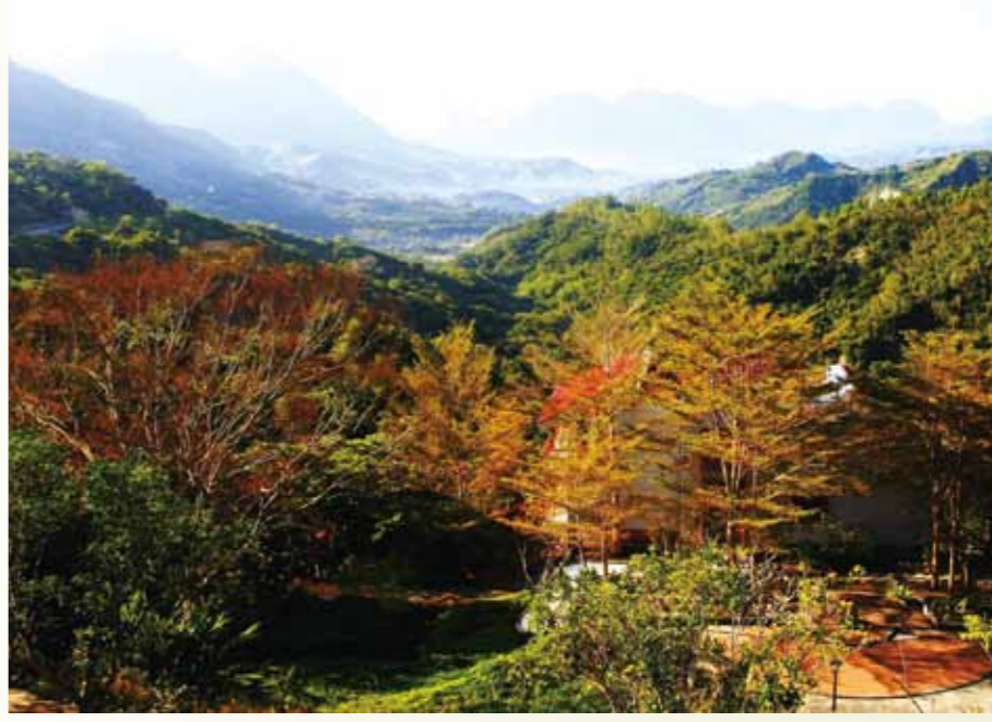
▲從東河休閒農莊的制高處，可遠眺一片山景樹海。

沿著登山步道，來回約需兩個小時。拾階進入森林，熱帶雨林的豐沛生命力，如交錯盤生的藤蔓、濃蔭的闊葉林等處處可見，伴著橋下潺潺溪水，在炎炎夏日，沁出一陣清涼及靜謐。途中還有一線天、小瀑布、水濺洞、望天崖、狀元臺等奇景，大自然的鬼斧神工，值得前往一探究竟。登頂後，絕佳視野，近可攬觀泰源盆地的幽境遼闊，遠可觀賞日出，使人心曠神怡。