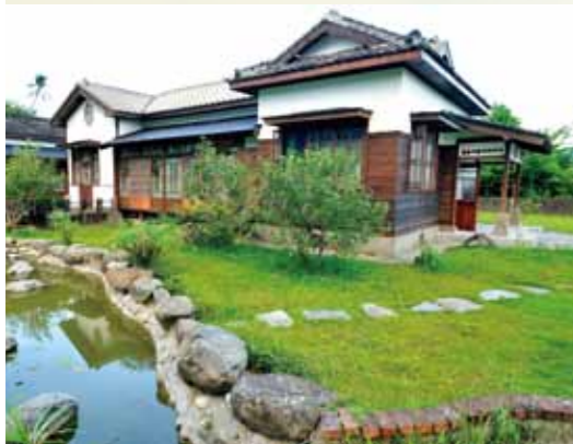
▲有著百年歷史的花蓮榮民會館，木造建築，散發日式風情。