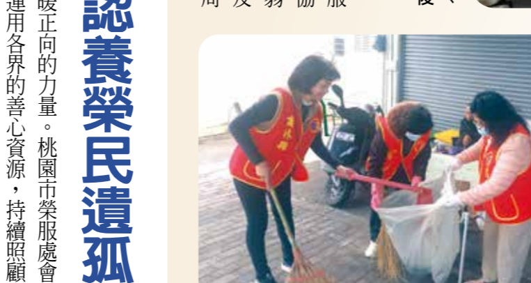
雲林縣榮服處志工協助六林伯伯打掃居家。