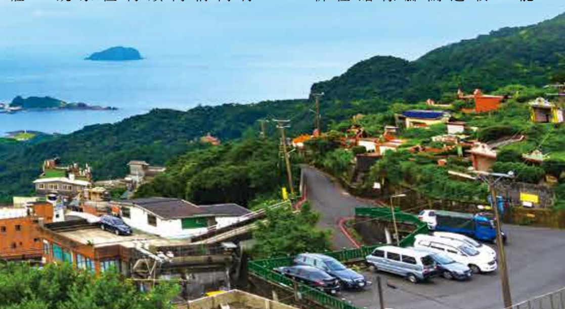
山、海、港口、老街，共同構成九份和金瓜石的美。