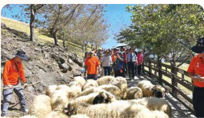
除了奔羊節，遊客還可在農場內近距離欣賞羊群悠閒漫步高山牧場的可愛畫面。

【本刊訊】迎接新春，清境農場一年一度最具代表性的特色活動「奔羊節」，也在二月十三日熱鬧登場，提供遊客最佳旅遊體驗。 適逢清境農場成立六十五周年，農場除舉辦年度重頭戲「奔羊節」主活動，並於農曆年前後同步推出一系列結合牧羊文化、節慶氛圍與遊客互動的精采活動，邀請民眾走進高山草原，感受清境農場獨有的自然魅力。 奔羊節活動是全臺灣唯一在高山公路上進行牧羊遊行的活動。約一百一十五對可愛的綿羊在專業牧羊人的帶領下，沿著臺十四甲線合歡山公路壯麗行進，羊群奔騰的場面與周圍粉嫩的櫻花相輝映。 清境農場規劃多場暖身性質的系列活動，讓無法於當日參與奔羊節的遊客，也能親身體驗牧羊文化的樂趣。清境農場指出，活動期間凡參加寒假時段「牧羊人活動」的遊客，皆可獲得新春好禮，讓親子旅遊及春節走春行程更加豐富有趣。農場也誠摯邀請民眾於農曆年前後走訪清境農場，透過一系列牧羊主題活動，體驗高山草原的自然風情與濃厚節慶氛圍。