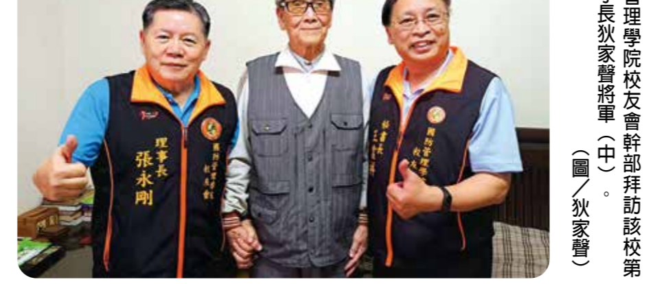
國防管理學院校友會幹部拜訪該校第一期學長狄家聲將軍(中)。