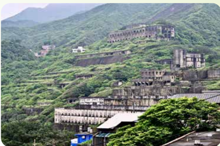
遠眺十三層遺址，景觀宛若荒廢的美麗宮殿。

感。民國二〇八年由國際照明藝術大師、新銳藝術家等合作而成的「點亮十三層」公共藝術，讓人再次看見當年黃金山城的壯闊，喜歡攝影的旅人，可別錯過十三層的夜景。想一睹遺址獨特的荒涼之美，建議可至水湳洞停車場仰望，或到長仁社區觀景亭側看，角度最為動人。