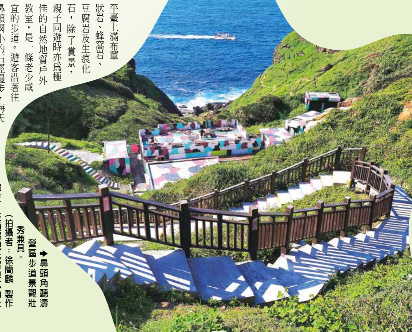
鼻頭角燈塔，美景，景色相當宜人。

鼻頭角區域集東北角海岸海蝕地形之大成，尤其海崖、海蝕凹和海蝕平臺之發育更是全臺少見。海蝕