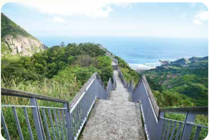
短程的報時山步道，不但輕鬆好走，景觀更是一流。

鼻頭角燈塔約於西元一八九七年建造完成，舊塔原為日據時代興建的六角形鐵塔，第二次世界大戰時遭盟軍轟炸，嚴重損毀。戰後眾人有意改建之議，於民國六十年改建為鋼筋混凝土白色圓塔，塔高約十二公尺。燈塔附近地質景觀豐富，可以觀賞山海交界的特殊海蝕地形，亦可沿著碧草如茵的階梯及紋路粗獷的斜坡，登上山腰間步道，一覽