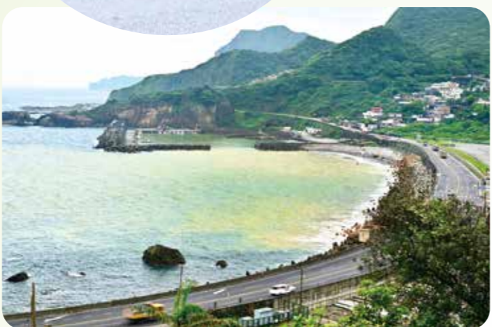
陰陽海的海水呈現金黃、蔚藍分隔，對比分明的奇特景象。

感。民國二〇八年由國際照明藝術大師、新銳藝術家等合作而成的「點亮十三層」公共藝術，讓人再次看見當年黃金山城的壯闊，喜歡攝影的旅人，可別錯過十三層的夜景。想一睹遺址獨特的荒涼之美，建議可至水湳洞停車場仰望，或到長仁社區觀景亭側看，角度最為動人。