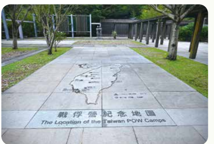
國際終戰和平紀念園區原為一戰期間日軍的金瓜石戰俘營。

國際終戰和平紀念園區原為二戰期間日軍的金瓜石戰俘營。當時在營內關押二戰時期的戰俘，包括英國、加拿大、荷蘭、澳洲、紐西蘭、南非、美國等。這批盟軍戰俘在遭監禁時期的勞務工作，即為採掘銅礦。由於當時生活與工作條件大差，管理嚴苛、醫藥不足，以及水土不服等因素，不少戰俘命喪於此。現規劃為國際終戰和平紀念公園，陸續設置歷史解說牌、光雕、重現紀念碑等，並連結周邊景點，成為旅遊新地標。