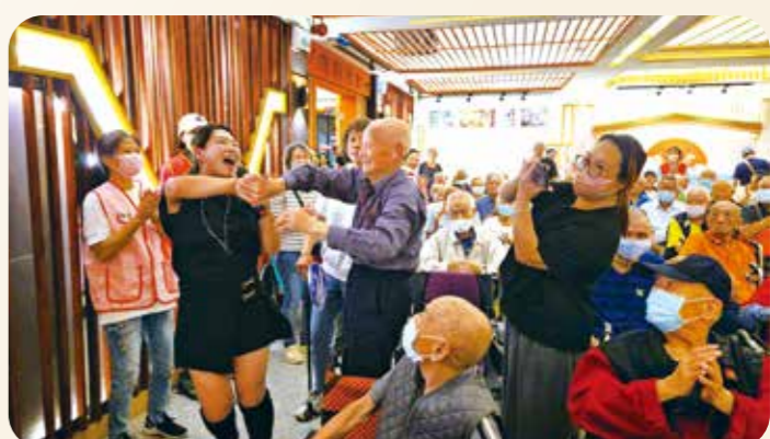
行動需人協助的長輩被歡樂氣氛感染，緩緩站起與藝人共舞。

白河榮家：舉辦端午聯歡會，「在水一方咖啡莊園」帶來薩克斯風演奏與國樂舞。隨後表演《內山姑娘》。