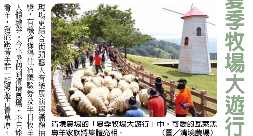
清境農場的「夏季牧場大遊行」中，可愛的瓦萊黑鼻羊家族將集體亮相。

【本刊訊】熱門避暑勝地「清境農場」宣布，自七月八日至八月二十六日，每周三推出「夏季牧場大遊行」，由人氣迷你馬「嚕嚕米」領軍，可愛的瓦萊黑鼻羊家族集體亮相，邀請遊客走進高山牧場，體驗最具有特色的暑假活動。 清境農場表示，民眾不必遠飛瑞士，在清境農場就能看見「一大群」瓦萊黑鼻羊（笑笑羊）。這次大遊行不只是觀光，更是邀請民眾走進動物的家，看著黑鼻羊寶寶搖搖晃晃跟著媽媽走在草地上。活動期間同步串聯多項深度探索亮點，想跟「柯麗黛小羊」拍出「讚」數破千的同框照嗎？只要帶著清境限定的在地好物，就能直接解鎖「小羊照相館」的專屬Vlog，親密互動，名額有限，動作要快喔！ 此外，「青青草原探索趣」鼓勵民眾以低碳步行，帶著熱門手遊深度探索園區，