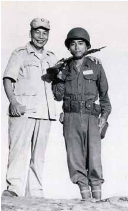
↑經國先生（左）與國軍弟兄。

「如果我只有一口飯，這口飯會先給榮民吃。」經國先生這句話猶在耳，至今仍感動無數人。蔣故總統經國先生於民國四十五年至五十二年，共八年的時間主持輔導會，他曾說希望把輔導會的工作，當作是我們的事業，心心念念榮民弟兄。在經國先生的主持下，訂下了輔導會六大工作目標：「誠懇實在的服務、任勞任怨的負責、公正無私的辦事、冒險犯難的創業、日新又新的求進、如兄如弟的親愛」，這六句話成為了輔導會的中心思想。