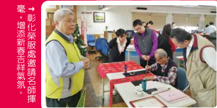
→ 彰化榮服處邀請名師揮毫，增添新春吉祥氣氛。