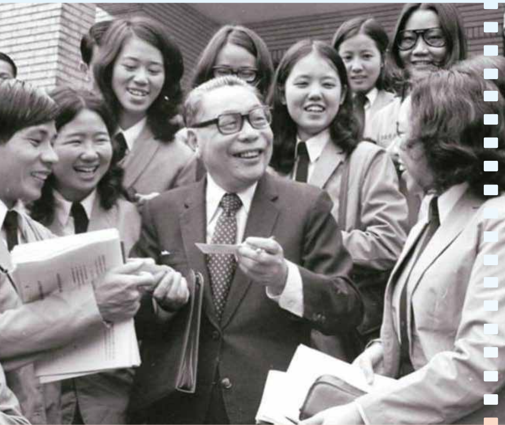
↑經國先生受到民眾的愛戴。