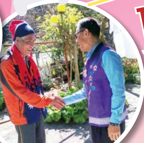
↑ 花蓮榮服處榮民戴伯伯(左)看到處長(右)長途跋涉到訪非常開心。