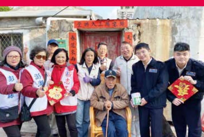
↑ 澎湖縣榮服處同仁帶領替代役男及志工，為長者打掃環境，張貼手寫春聯。