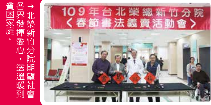
→ 北榮新竹分院期望社會各界發揮愛心，送溫暖到貧困家庭。