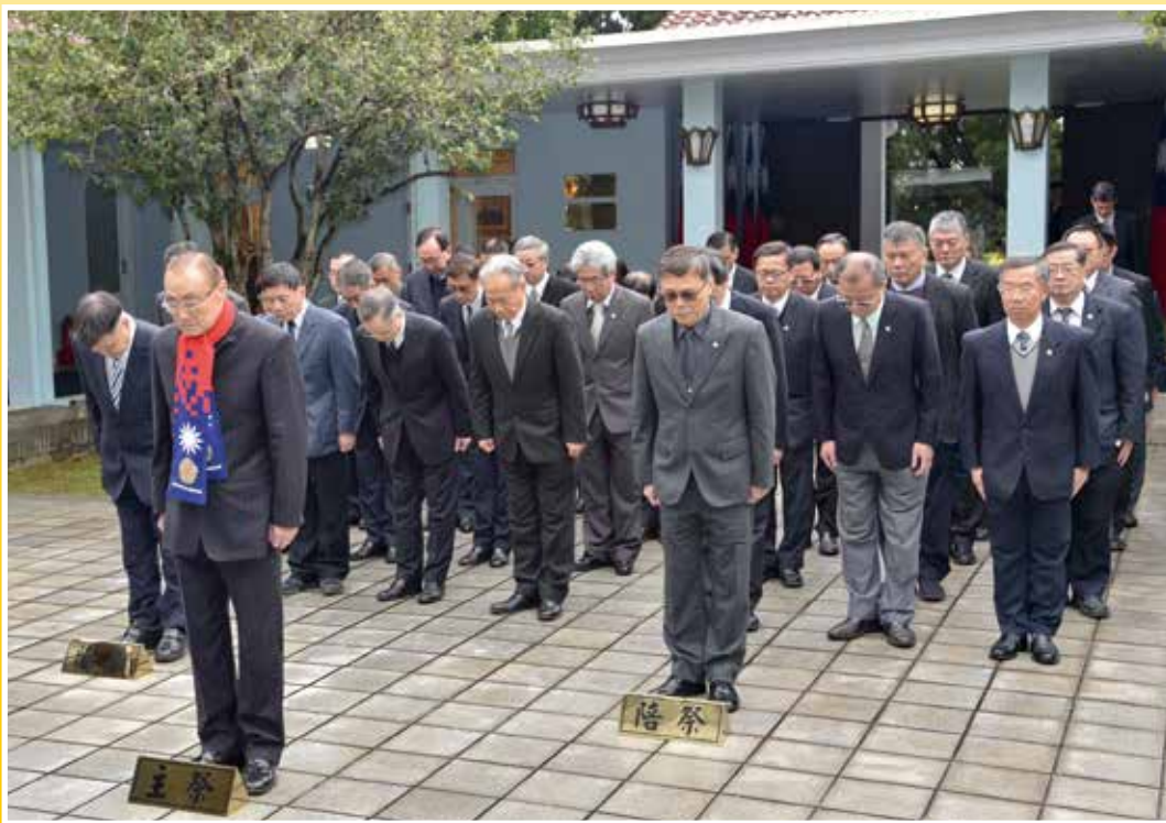
↑主任委員（前）率輔導會一級首長向經國先生致意。

經國先生於民國四十五年主持輔導會，五十二年卸任，任內成立榮民工程事業管理處，率領榮民投入國家各地的建設。 經國先生除了戮力照顧榮民之外，也促進榮民投身建設國家行列，繼續奉獻國家社會，讓榮民能各司其職、退休榮民能頤養天年，經國先生的奉獻，是輔導會、榮民弟兄、榮眷心目中永遠的大家長。