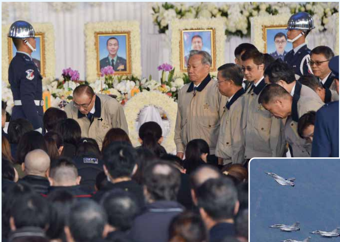
↑主任委員（左2）向黑鷹罹難將士家屬致意。