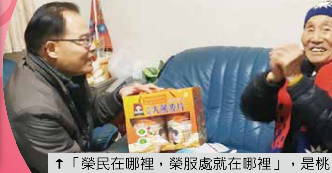
→ 臺東榮民服務處與日光寺攜手送暖，祈求新的一年平安吉祥。

恭賀新禧！又到了溫馨熱鬧的農曆春節，今年適逢金鼠年，輔導會所屬各榮家、榮院及榮服處在歲末將關懷送到榮民(眷)家中，也舉辦各種新春聯歡及應景活動，為的是讓榮民長輩們感受到年節的氣氛，開心迎接新的一年。