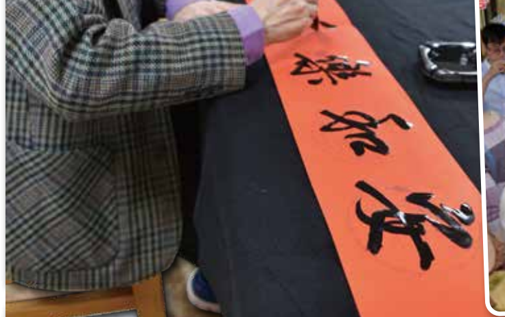
↑書法老師在餐會現場提筆揮毫。(記者林建榮/攝影)