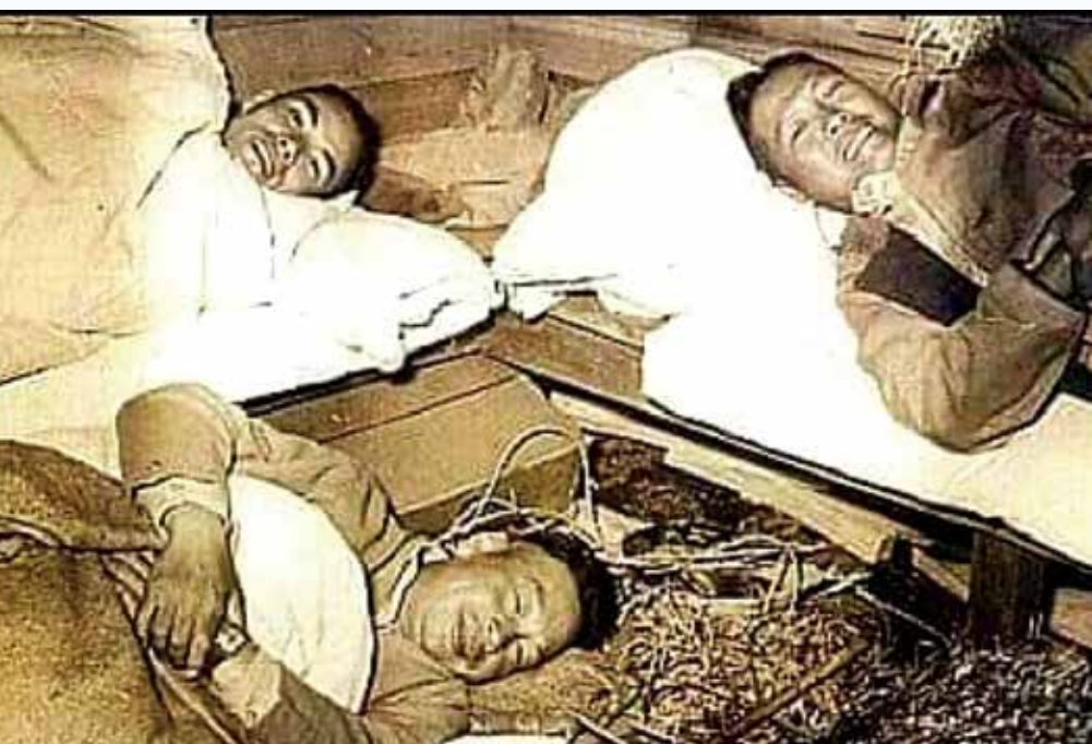
↑經國先生讓榮民睡木板床上，自己則席地而睡。