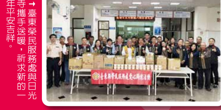
→ 臺東榮民服務處與日光寺攜手送暖，祈求新的一年平安吉祥。