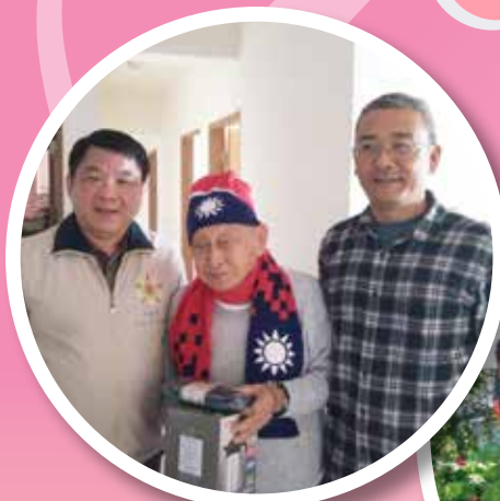
↑ 高雄市榮服處致贈榮民伯伯國旗圍巾及毛帽、保溫壺。