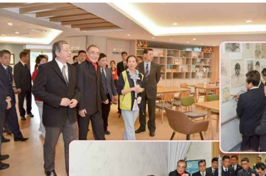
→主任委員（左3）仔細地向板橋榮家人詢問水療機各項功能。