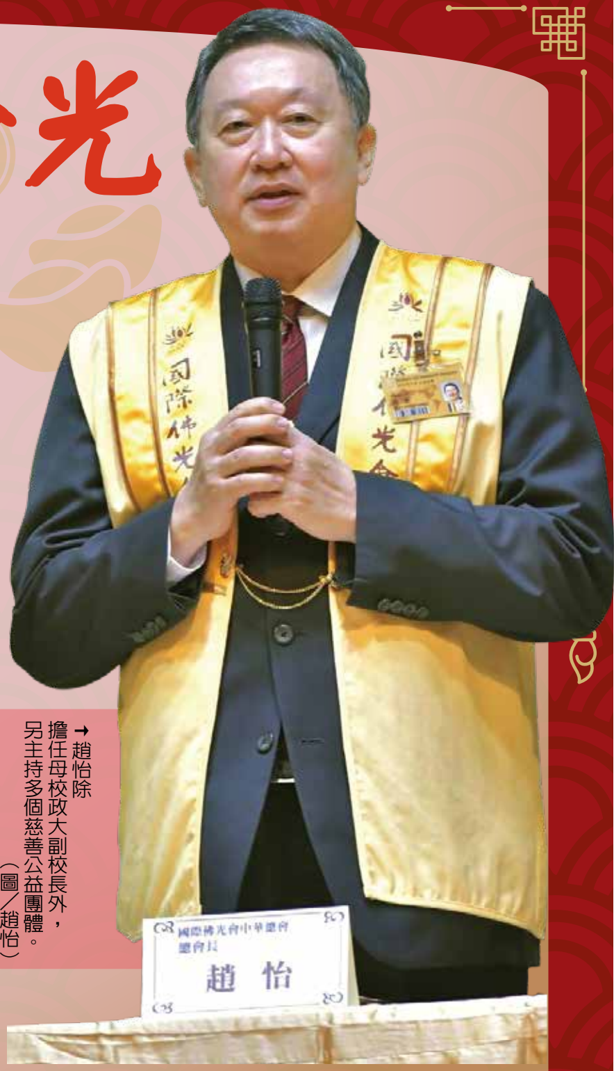
→趙怡除擔任母校政大副校長外，另主持多個慈善公益團體。

現任政治大學副校長、資深媒體人與公益家趙怡，曾在世界各地留學、工作與生活，但最讓他懷念的，還是那段眷村歲月。他的父親趙錦龍，在民國三十六年調來臺灣，是早期來臺海軍部隊中的少數高階軍官。 父親職務調動頻繁，趙怡雖在基隆出生，後來全家遷至位於高雄左營的明德新村，一直到民國五十六年才遷出，他在眷村住了近二十年，「我們家搬到左營後，父親職務反而從此沒再調回左營。」趙怡笑著說，家中諸多事務，就由現年已九十八歲的母親一肩扛起。 明德新村與軍事機關同處一地，無法自由進出，趙怡記得即使同學要到家裡玩，都得查驗眷補證等文件；不過，村內幾乎夜不閉戶，加上左鄰右舍雞犬相聞，治安比其他地區還好。當時眷村生活困苦，居民不分長幼，常是衣穿四季，要換上新衣，就得等到過年。