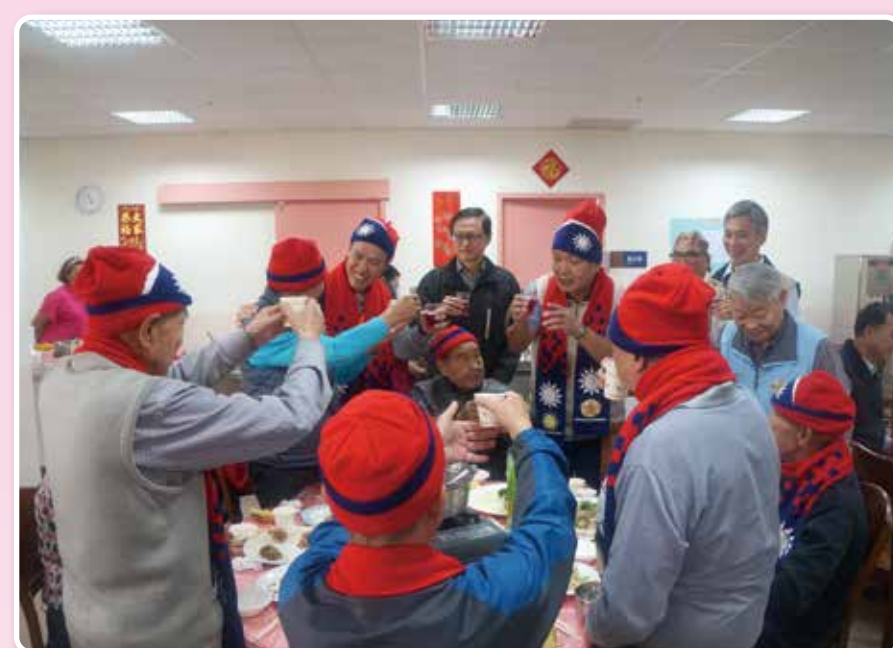
↑李副主任委員(右三)向雲林榮家住民敬酒。

【本刊訊】副主任委員李文忠日前出訪彰化、雲林榮家致贈春節加菜金,祝賀住民長輩們春節快樂。李副主任委員慰勉榮家同仁們的辛勞,並叮囑要在春節期間,安排康樂表演活動,以紓解住民思鄉情緒;且近日氣溫不穩定,應特別關注長輩的身體健康狀況。 李副主任委員至雲林榮家致贈春節加菜金時表示,年前天冷,財團法人榮民榮眷基金會特製製作圍巾、毛帽發送給長輩禦寒,他謹代表主任委員致贈團體加菜金四萬元為大家加菜。 李副主任委員感謝榮家所有工作人員的努力與付出,使住民們都感受到最好的服務與照顧,讓長輩活得好、活得好。