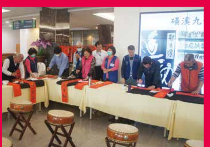
↑ 臺中榮總希望民眾把熱騰騰的新春喜氣帶回家。