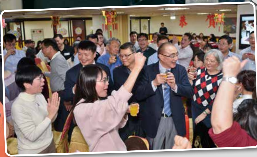
↑主任委員(前排右2)逐一向輔導會同仁致意,感謝同仁們的辛勞。(記者林建榮/攝影)

【記者施奕安/報導】輔導會日前舉辦尾牙餐會,主任委員致詞時表示,感謝輔導會所有同仁這一年的辛勞,尤其是副主任委員及主任秘書,替主任委員出訪各地榮家、榮院及榮服處,給予所屬單位同仁打氣。 主任委員說,他所推動的金字塔三級醫療照護計畫、公文簡化都已開始實施,他特別為公文簡化作業取名為「榮喜」,讓榮民能夠歡喜,讓榮民能夠感受到輔導會對他們的照顧。主任委員還表示,之後將出訪輔導會各所屬農場,視各農場經營現況做出改善的規畫,並將此出訪行程定名為「樂山計畫」,旨在以喜樂敬重之心,接近大自然。 輔導會尾牙餐會現場請來書法家張明榮、許素涵、蔡金城、郭偉煌揮毫寫春聯,並邀請基隆長興與呂師父龍獅團一同共襄盛舉。餐會最後,主任委員期許輔導會所有同仁仍須盡所有力量,全心照顧好榮民(眷)。 ↑輔導會同仁們感謝主任委員的帶領,讓輔導會更上層樓。(記者林建榮/攝影)