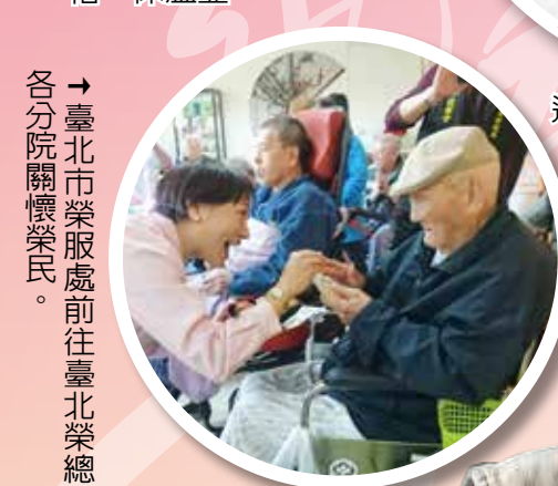
→ 臺北市榮服處前往臺北榮總及各分院關懷榮民。