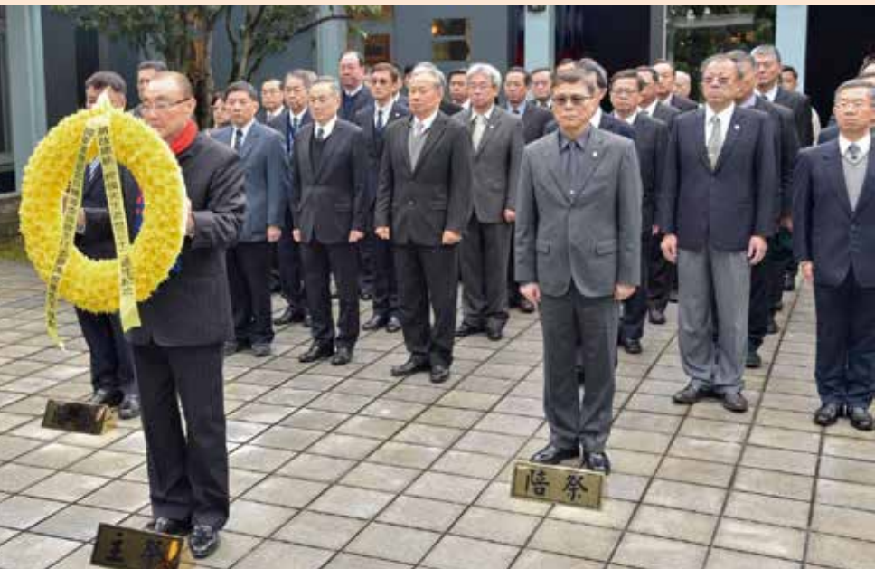
↑主任委員率領輔導會同仁向經國先生獻花致意。

我永遠難忘民國七十七年的這一天，正是我們國軍在昔時的「政工幹校」召開全軍訓練總檢討，下午突然接獲通知於中正堂集合，約於十五時三十分總長郝上將蒞臨，竟滿面哀戚，以低沉的聲音宣布：「我們敬愛的總統經國先生今天辭世了，現在大家儘速回到工作崗位，注意油、彈安全，儘速完成戰備整備。」我匆忙地回家，正好碰到就讀師大附中的女兒，她問說：「你不是明天休假嗎？」我說：「我有重要的事先回部隊了。」顧