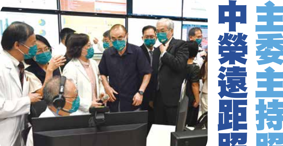
主委主持照顧推動專案會議，中榮遠距照顧中心揭牌營運。

李副主委出席美國退協年會 致詞感謝長期支持中華民國 【本刊訊】副主委李文忠於八月十七日在「美國退伍軍人協會」年會開幕式及婦女大會致詞，感謝該協會長期支持中華民國，每年於年會通過支持中華民國決議文，敦促美國政府及國會遵守「臺灣關係法」，出售先進軍事裝備、武器及科技予我國，並給予中華民國總統與他國元首訪美時相同的尊崇與禮遇。 於美國退協年會致詞 頒贈總會長榮光獎章 會議在美國路易安那州紐奧良市舉行，李副主委於開幕式會議中，代表主任委員頒贈美國退伍軍人協會總會長霍因一等榮光專業獎章，表彰他對退伍軍人福祉、伸張國際正義及致力維護中華民國國際生存空間的貢獻。