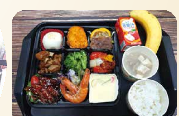
各榮家推出的快樂餐，不但菜色多元(上圖)，而且供餐方式也充滿創意(左圖)。(圖／新竹榮家)