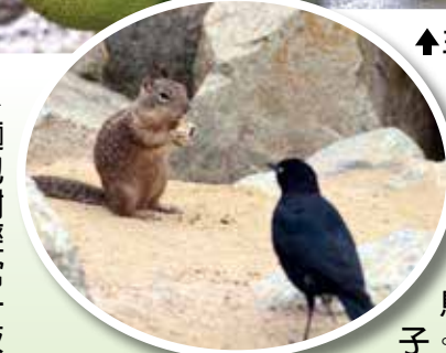
↑臺北市推動都市公園化成功，松鼠和鳥兒常潛入院落吃果子。