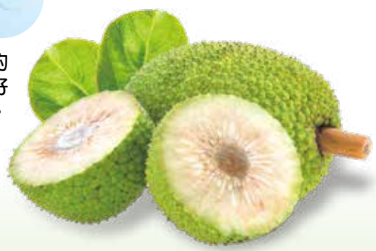
↑麵包果味似馬鈴薯，可以切絲炒肉絲，也可切塊煮湯喝。

樓上的安全圍牆高度僅及膝，遠一點的構不著，為了自己的安全，只好無奈地由它去吧！現在是把構得著的，又是二個長在一起的，輕鬆地把不到陽光的給摘掉一個就行了，但那三個、四個長在一起，又一般大的，摘哪個