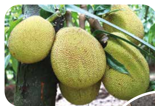
↑麵包樹經常一枝結四、五個麵包果，必須疏果才長得好。