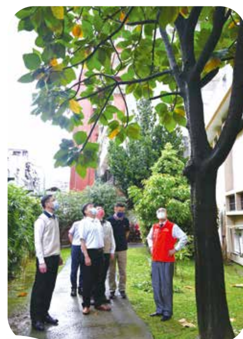
↑主委（右）打算摘下游麵包樹上的麵包果，與同仁們分享。