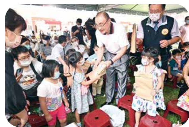
▲主委發粉蠟筆給高雄榮家幼兒園的小朋友，鼓勵他們追求色彩的美好人生。

我好奇地問其中一位解說飛行員：「你們怎麼會想到要接待這些孩子來參觀？還告訴我們，他們是「貴賓」，他們懂什麼呢？回想我們的空軍基地，連飛行員都不可以和自己飛的戰機合影，遑論開放給孩子們參觀了。」他回答我：「Sir，They are our future！」(長官，他們是我們的未來！) 這句話讓我迄今難忘！