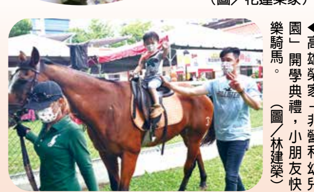
▲高雄榮家「非營利幼兒園」開學典禮，小朋友快樂騎馬。