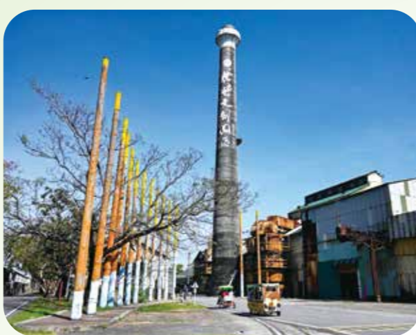
橋頭糖廠把閒置的百年廠區空間再造，保留糖廠歷史原貌，注入藝術新生命。

橋頭糖廠已有百年歷史，列為市定古蹟，乘坐鐵軌上的五分車，更能懷著追溯源頭之心，探索其歷史意義。糖廠裡擁有日式與仿巴洛克式的熱帶殖民樣式建築，以及紅磚水塔、彈藥庫、觀音銅像等十九處古蹟，訴說著早期產業發展奮鬥的過往。在這裡，吃著臺糖冰棒，是許多網友流行的打卡儀式，另外，金馬獎得獎電影《血觀音》拍攝場景之一的日式老屋，也是追星拍照打卡的熱門景點。