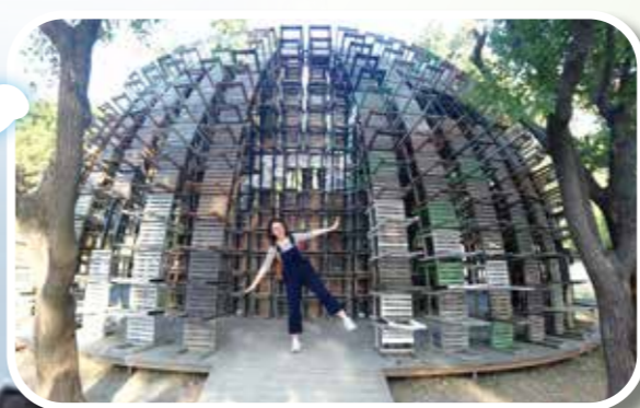
裝置藝術「椅子樂譜」矗立於駁二藝術特區大義公園內，為拍照打卡熱點。

音樂、公共藝術等展演場域，匯集來自全球各地的藝術創意，透過一次次的展演，激盪出嶄新火花，展現海港城市的獨特魅力文化與生活美學。 旅人可於欣賞完駁二藝術特區後，漫步到臨近的西子灣與高雄愛河，一睹夕陽美景，為此趟旅行留下美好回憶。