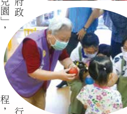
▲花蓮榮家住民和幼兒良好互動，顯示了家庭化方向的正確。