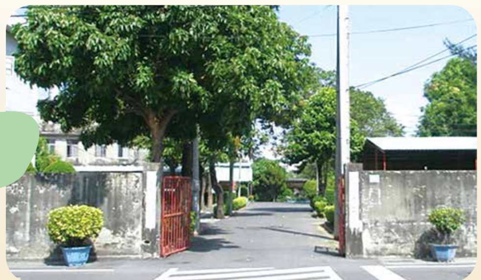
臺南市大成路上的「長青園」，位於水交社邊陲，也留下一段特殊的榮民歷史。

長青園的榮民們，儼然是在軍旅之後換個地方和同胞共度晨昏。政府開放大陸探親之後，他們生活上有了另一種寄託。大家心繫大陸故鄉的血脈親情，年邁之際還興奮地踏上探親路，一幅幅「少小離家老大回」的寫照。