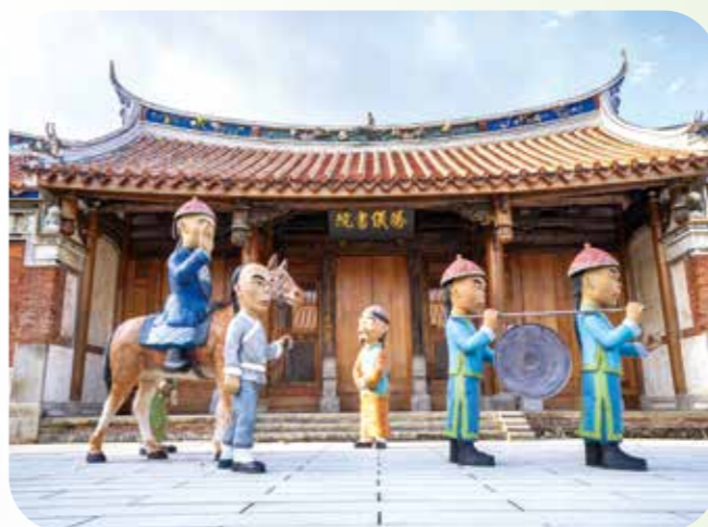
鳳儀書院園區佈置 Q 版人物塑像，讓遊客參訪歷史古蹟時，可拍照留念，極具趣味。

有人說步行與搭乘大眾運輸工具，是認識一座城市最好的方法。到高雄旅遊，搭乘捷運與輕軌，兩者間有所交集，轉乘又便利，成為觀光高雄市區的最佳工具。搭乘捷運旅遊時，內心流淌的言語與外在景致相互跳躍，反映了旅人喜悅又興奮的情緒。 糖金歲月 橋頭糖廠