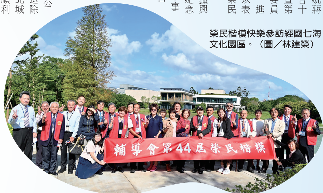
榮民楷模快樂參訪經國七海文化園區。