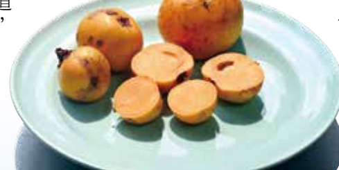
▲切開的福果，果瓢也是黃色的，味甜。