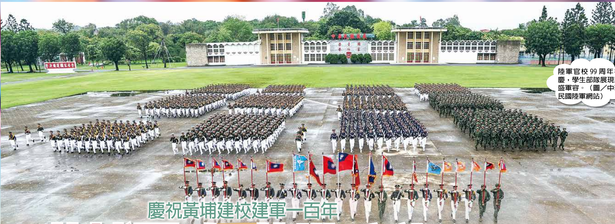
陸軍官校 99 周年校慶，學生部隊展現壯盛軍容。（圖／中華民國陸軍網站）