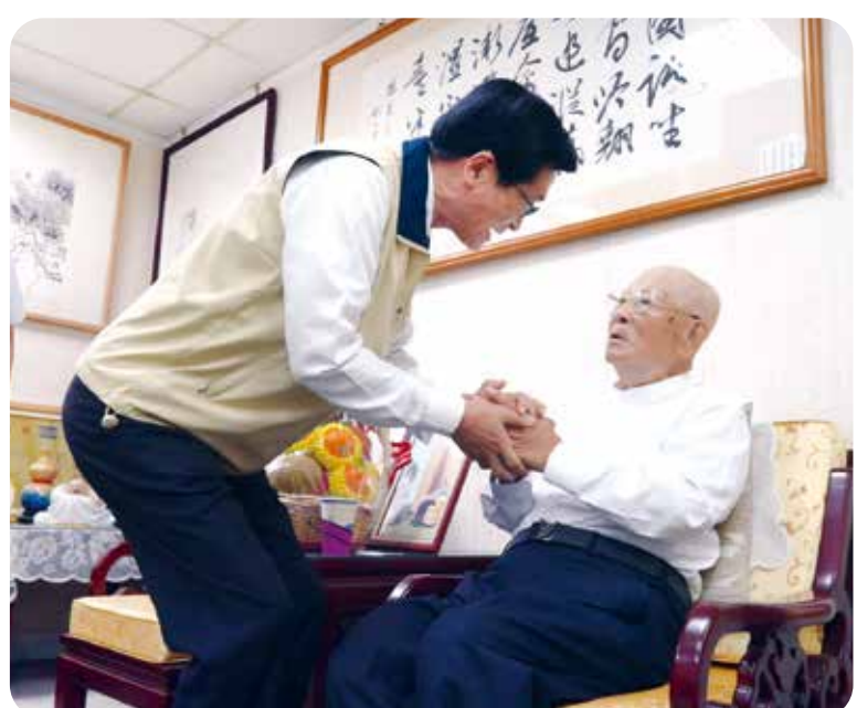
嚴主委(左)親切地向許老爹(右)問候請益。

【本刊訊】主任委員嚴德發上任後，立即啟動請益之旅，在相關處長陪同下，分別於五月二十二日、二十三日，拜訪前主委許歷農、楊亭雲，主委推崇兩位前輩為輔導會立下典範，表示他將在兩位前主委的指導下，持續為榮民服務。 被親切地稱為「許老爹」的許前主委，今年已一〇七歲，依然精神奕奕，端坐迎接主委，感謝主委一上任就來探視，並嘉許：「你們是一任比一任好。」 主委表示，這是因為許前主委基礎打得很好，在輔導會任職五年多，照顧許多老袍澤，今後將秉持老多多的教誨，繼續照顧好退除役官兵。主委也向老爹報告，現在榮家很多設備都在更新，不斷進步；許前主委聽了頻頻點頭，非常欣慰。 主委次日拜訪前主委楊亭雲。楊前主委高齡九十七歲，對輔導會業務仍極為關切，一見面即詢問老榮民、就養榮民、外住榮民及輔導會人力等現況，主委及陪同的處長一一向前主委報告。 主任委員表示，輔導會的核心理念就是服務榮民，未來將整合各地區資源，落實「榮民在哪裡，服務到哪裡」的理念，也謝謝老主委的指導。