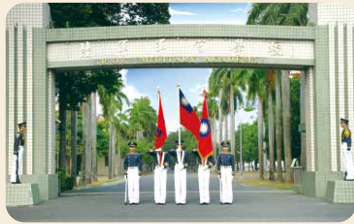
鳳山陸軍官校大門。

八二三戰役期間，金門國軍砲兵部隊對共軍進行反砲擊，給予敵陣地毀滅性打擊。海軍在「八二四」與「九二」兩次海戰，擊沉、重創共軍多艘魚雷快艇及砲艇。海軍陸戰隊「5」部隊突破水際及共軍岸砲之封鎖，搶灘成功，圓滿完成對金門的運補任務。我空軍與中共空軍在臺海爆發十三次空戰，擊落敵機三十二架，戰果輝煌。友邦美國軍援我武器裝備和物資外，派遣飛彈部隊與空軍戰鬥機協防臺灣。我國與美國軍事上的密切合作，有助於嚇阻中共進一步的軍事冒進，結束了第二次臺海危機。