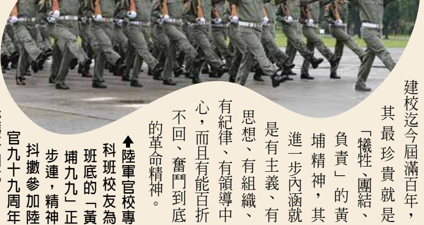
陸軍官校專科班校友為班底的「黃埔九九」正步連，精神抖擻參加陸官九十九周年校慶分列式。

黃埔創校校長蔣中正曾說：「我們革命的黃埔是團結一致，挽救國家於危亡的黃埔，是犧牲奮鬥，以求國家之自由平等的黃埔，是為中華民國盡了繼往開來責任的黃埔。」黃埔建軍建校迄今屆滿百年，其最珍貴就是「犧牲、團結、負責」的黃埔精神，其進一步內涵就是「有主義、有思想、有組織、有紀律、有領導中心，而且有能百折不回、奮鬥到底的革命精神」。