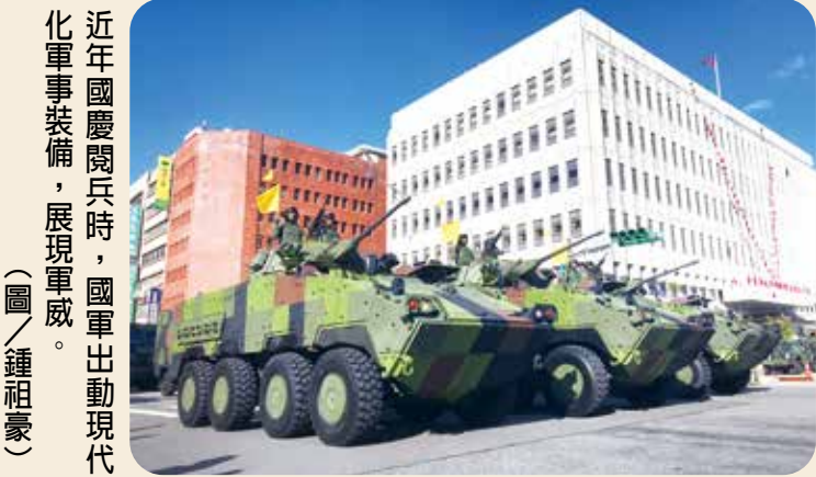
近年國慶閱兵時，國軍出動現代化軍事裝備，展現軍威。