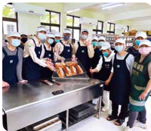
替代役男與用心烘焙麵包的學員合照。

本次見學來到臺北榮總玉里分院，向當地的醫護人員學習。玉里分院是國內指標性的精神科專科醫院，曾經是亞洲地區精神照護的模範。而其中最具有代表性的，莫過於以醫院為起點向外拓展，結合社區資源，讓精神病患與社會共榮的治療模式。 在玉里模式中，所有的學員都會經歷數個治療階段。從一開始容易發作的急性重症，先透過持續性的藥物控制，降低發作的頻率與攻擊行為。到中期在院內的向陽學苑參與創作手工藝品等藝術治療，讓學員打破心理層面的藩籬，並認識自己，學習自我照顧與管理情緒。最終在社區據點進行職能復健，學習職業技能與人際溝通，重新與社會建立連結，直到能夠完全自力更生。 而令我訝異的是，如果不是經由醫護人員的提醒，我完全不會知道