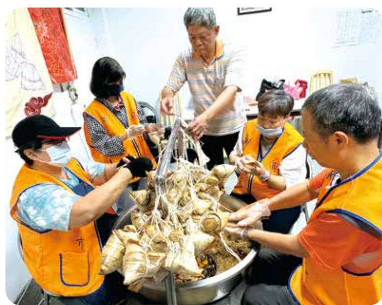
新北市榮服處偕屬機構及投資事業人員共同包肉粽，以分贈需照顧的退伍袍澤。

【本刊訊】彰化榮家位於八卦山南麓，所種植的芒果、桑葚等果樹最近開始結果，山上獼猴爭先侵入採果，為避免人猴衝突，榮家向住民長輩及全體員工宣導猴群生態習性，與遇到獼猴時之因應對策。 彰化榮家指出，往年猴群僅在榮家外圍芒果樹大道逗留，及在外圍竹林排排坐乘涼，今年猴群出現攀爬榮家房舍及果樹情形，為避免影響住民長輩的生活，榮家向彰化縣政府農業處反映，獲配發起跑槍一把及驅猴炮，可不定時定點於家區放炮，警示猴群勿進入生活區域，以免造成人猴衝突。