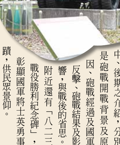
臺北市八二三紀念公園內，有紀念碑及八二三時期火砲。

臺北市圓山飯店旁的「八二三砲戰紀念公園」，內有八二三海戰役勝利紀念碑，另臺北市政府與國防部協調，提供歷經八二三砲戰時期的二