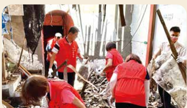
彰化縣榮欣志工幫忙受災榮民(眷)清理水退後留下的垃圾。

【連線報導】強颱凱米颶風過後，各榮服處處長均偕同仁前往災區關懷受災弱勢榮民(眷)，發放慰問金及慰問品，表達輔導會的關懷，同時請榮欣志工幫忙整理環境，助受災榮民(眷)儘快恢復正常生活。 新北市榮服處：社區服務組長及榮欣志工前往新店區，關懷八十歲身障獨居榮眷余奶奶，並捲起衣袖幫忙打掃、割草，清理垃圾，避免淤泥堆積和蚊蟲孳生。 彰化縣榮服處：榮服處同仁偕榮欣志工抵達災區後，立刻捲袖清理，搬移泡水家具及雜物；志工阿媽們則負責清洗洗滿淤泥的紗門窗及小型物品。 南投縣榮服處：處長王怡文協請榮欣志工，由榮服處三長偕服務幹部帶領，前往土石流受災榮民(眷)家中，協助災後復原，並連結雪中送炭關懷協會，捐助