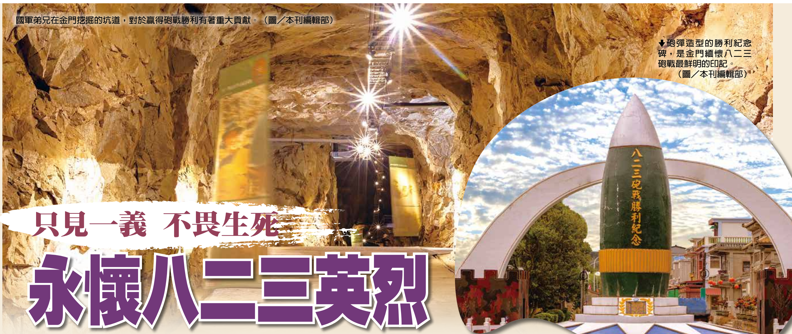
國軍弟兄在金門挖掘的坑道，對於贏得砲戰勝利有著重大貢獻。