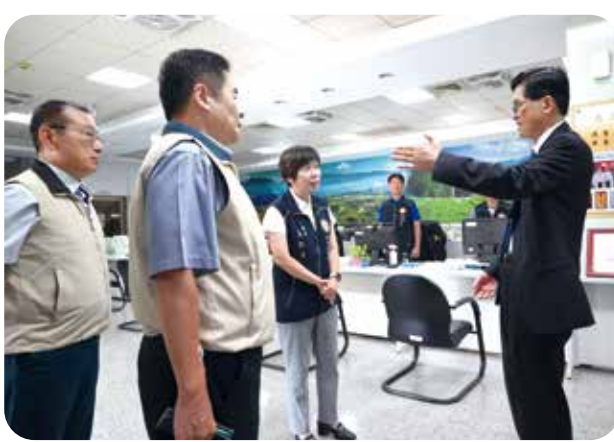
主委(右)期許榮服處以專業、高效的服務態度服務榮民(眷)，左起為副主委傅正誠、榮服處處長曹東發、南投縣榮服處處長王怡文。

【連線報導】主任委員嚴德發最近視導桃園、彰化榮家，及彰化縣、南投縣榮服處，主委在榮家與長輩親切互動，致詞表示輔導會將持續提供協助，擔任榮家及住民最堅強的後盾，並發給榮家團體慰勉金。主委也發給榮服處及榮欣志工團體慰勉金，以獎勵凱米風災後深入災區協助榮民(眷)打掃家園。 主委偕就養處處長周興國、服照處處長曹東發、桃園市榮服處處長鄭源敏、欣中天然氣公司總經理陳曉明等視導桃園榮家及彰化榮家，聽取榮家主任陳平、蘇再勝簡報。接著參與榮家活動，與住民話家常。主委勉勵榮家提升軟、硬體服務品質，透過之減輕照顧人力，並導入科技產品，提升醫療智能化。 此外，主委又視導彰化縣、南投縣榮服處，慰問服務同仁，鼓勵大家繼續為退伍軍人構建更完善的服務照顧體系，使退除(役)官兵的職涯轉換更有保障。主委也提醒榮服處應成為地區資源整合平臺，擴大資源整合，及時精準地投入服務，成為輔導會的應變前進指揮中心。