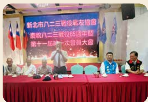
八二三老兵定期聚會，重溫那段保家衛國的歷史。

老兵，在金門的陸軍第十師三十團勤務連擔任文書兼傳令兵。在他的回憶裡，砲戰開始後傷亡相當慘重，士兵睡覺時手上都緊抱著槍，可是在這樣緊張的情況下，他們一樣堅持到底。他建議將八二三這一天定為國定紀念日，讓後世勿忘這場奠定臺灣數十年和平的戰役。