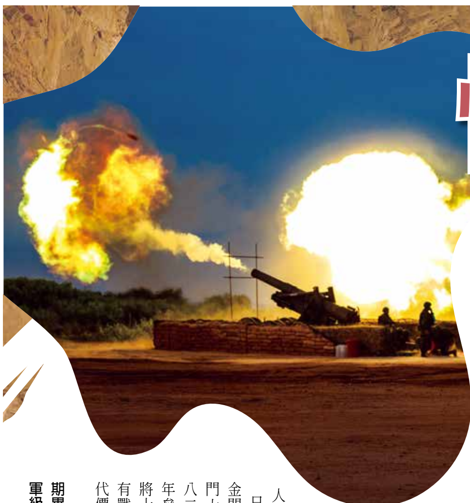
▲金門進行「漢光」操演，圖為八吋榴彈砲實彈射擊之震撼場面。

今年是雷南八三砲戰六十六周年，這場砲戰轟動全世界，也是我有生之年最難忘的回憶。當年我服役於陸軍六十九師，當日晚間，中共突然以四百多門火炮地毯式猛烈向金門大小島嶼濫射，造成全島煙塵瀰漫，兩個小時內落彈約五萬七千餘發。砲戰持續四十四天，全島落彈約四十七萬餘發。平均每平方公里落彈三千餘發。可見戰況之慘烈。金防部三位副司令官趙家驤、吉星文、章傑壯烈殉職。趙、吉兩位將軍、均為抗日名將，其他官兵傷亡不少。