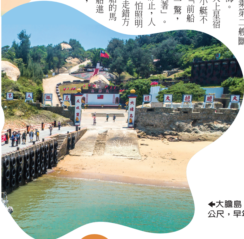
大擔島（即大擔島）距廈門僅4400公尺，早年被稱為前線中的前線。

一路上，無線電靜止，人員噤聲，怕探照燈、怕走錯方向。緊張得只聽到船的馬達和自己的心跳。船進抵大、二擔兩山之間，首先看到兩側微暗的山影，接著看到第一連在二擔靠岸，這才把心放下，那個舒暢快，無