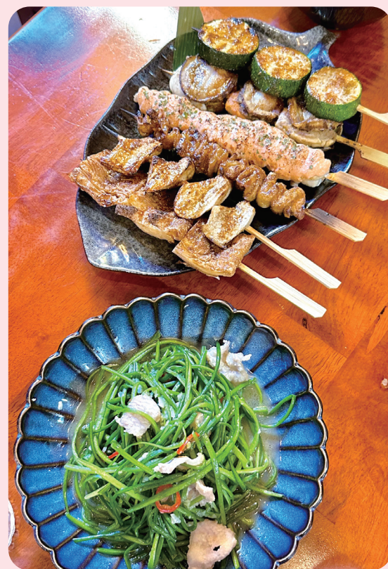
吃烤肉搭配蔬菜，可改善膳食纖維攝取不足的問題。