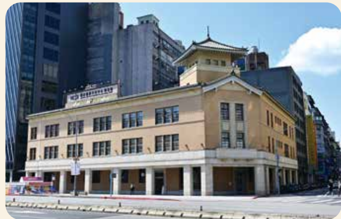
國家攝影文化中心中心臺北館前身是「大阪商船株式會社臺北支店」。

國家攝影文化中心中心臺北館定期更新攝影作品，讓人眼界大開，逐漸成為攝影愛好者的聖地。