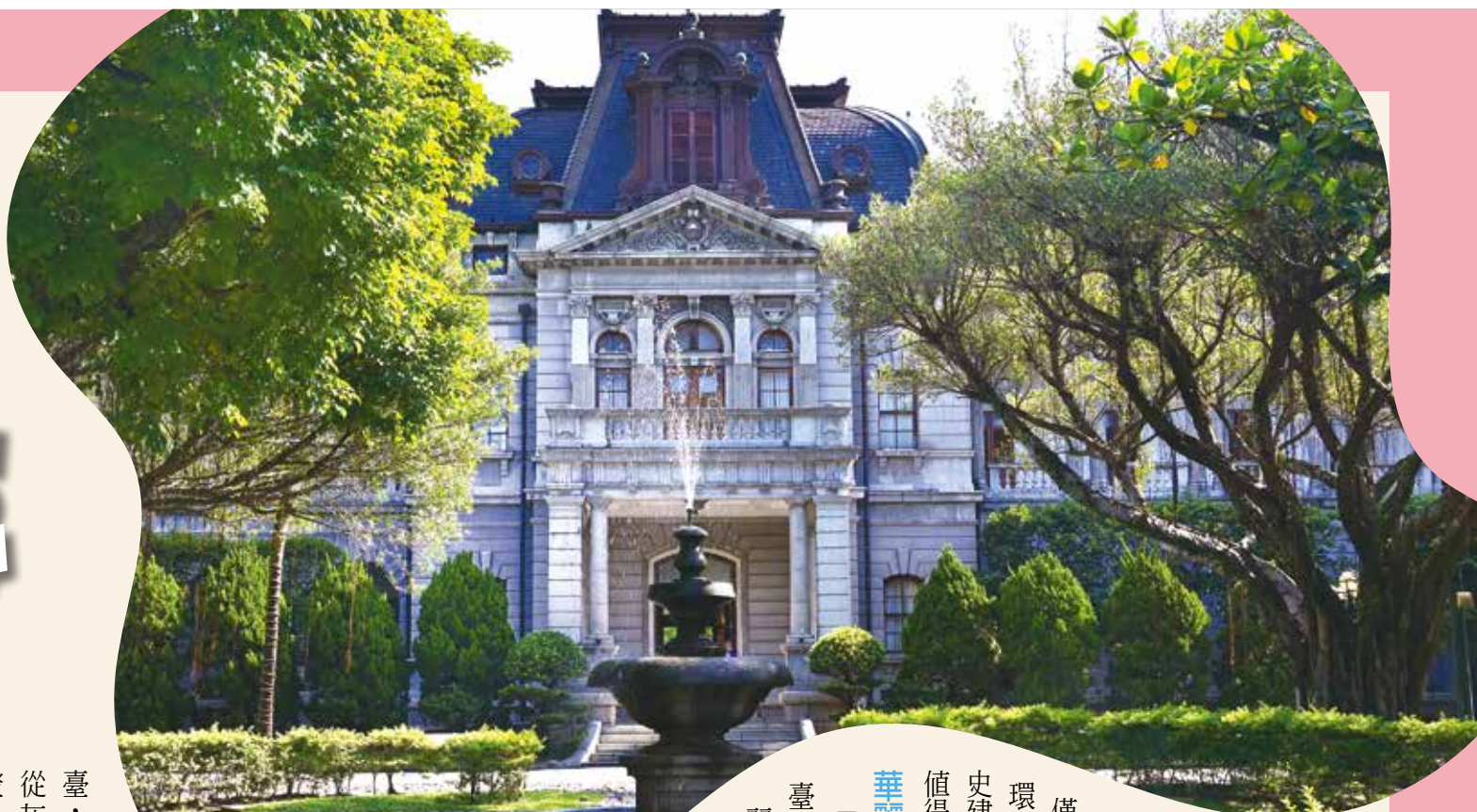
▲臺北賓館是巴洛克風格建築，門口的噴水池相當華麗。