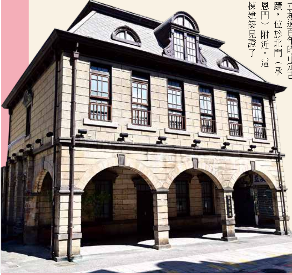
撫台街洋樓古蹟，位於北門（承恩門）附近的延平南路，是舊城區內古老的民間建築。

「撫台街洋樓」是臺北城內屹立超過百年的市定古蹟，位於北門（承恩門）附近。這棟建築見證了