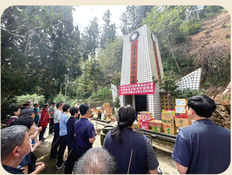
南投縣榮服處同仁在水里工作站人倫分站的「林業榮民殉職紀念碑」前，參加聯合祭儀。

【連線報導】慶中元，會屬機構感念陣亡將士及歷年在臺亡故榮民犧牲奉獻，紛紛舉辦盛大祭典，向前輩榮民英靈致敬，並辦理中元普渡，慰藉四方諸界，祈求榮、住民健康平安。 中元節期間，各榮家都在榮靈祠、榮靈堂，各榮院則在院區，由機構首長主持祭悼先賢先烈及亡故榮民典禮，邀請同仁及榮民代表、遺族家屬參加。白河榮家更商請「諾那華藏精舍」到榮靈祠進行超薦法會。各榮服處、榮家也在門前、行政大